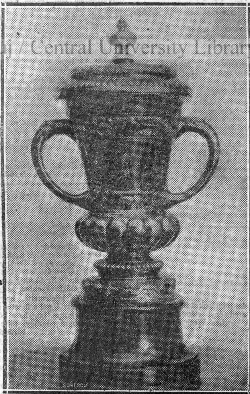
A kupa, amit még nem veszítettünk el . . . talán jövőre . . . győzni fogunk

A Glória versenyzői egyöntetűen kijelentették, hogy a pálya a leg- utolsó verseny tanúsága szerint élet- veszélyes és csak abban az esetben indulnak ha a Szövetség a pályát megfelelően rendbehozatja.