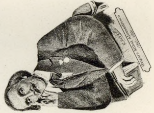
ȘTEFAN CEL MARE (1478-1500)