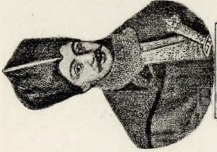
ȘTEFAN CEL MARE (1478-1500)