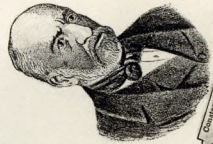
ȘTEFAN CEL MARE (1478-1500)