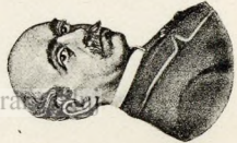
ȘTEFAN CEL MARE (1478-1500)