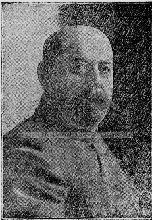
Generalul Berthelot (tata Bertălu), șeful misiunii franceze.

și 1150 subofițeri, toți dintre cei mai aleși ai armatei franceze, în frunte cu generalul