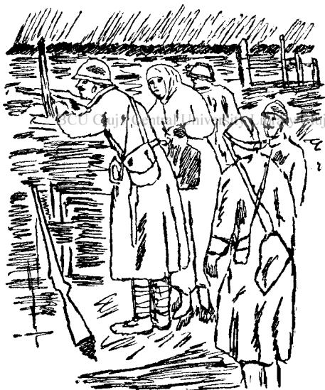
Regina noastră Maria cercetează pe soldați în tranșee.

ungare, bulgare și turcești năvălite în România, că într'adevăr pe aici nu se mai trece! Iar dacă străvechea vitejie moștenită de la strămoșii noștri, de la Daci, plămădită cu a celorlalți strămoși, Romanii, și rămasă pentru totdeauna în sufletul Românului, nu a reușit să alunge pe dușman atunci de pe pământul sfânt al României, cauza a fost trădarea Rușilor.