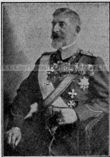
Regele Ferdinand Desrobitorul.

inflăcărare de nedescris. Zile întregi, străzile orașelor românești erau străbătute de cete de ficlori și bărbați chemați de goarna mobilizării, toți cu flori în pălărie, mulți în frunte cu ceterași, cari cântau cântece de vitejie.