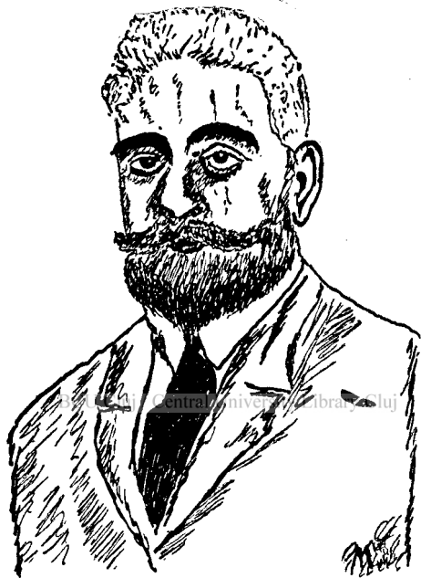
Ion I. C. Brătianu, prim-ministrul României în timpul războiului de desrobire.

Armata întâia română, care avea să atace pe dușman dela Olt până la Dunăre, era împărțită în trei grupe: cel dela Cerna (Dunăre), dela Jiu și dela Olt. Grupul dela Cerna , având să lupte contra unor întărituri puternice, al căror centru era Altonul, le-a cucerit în