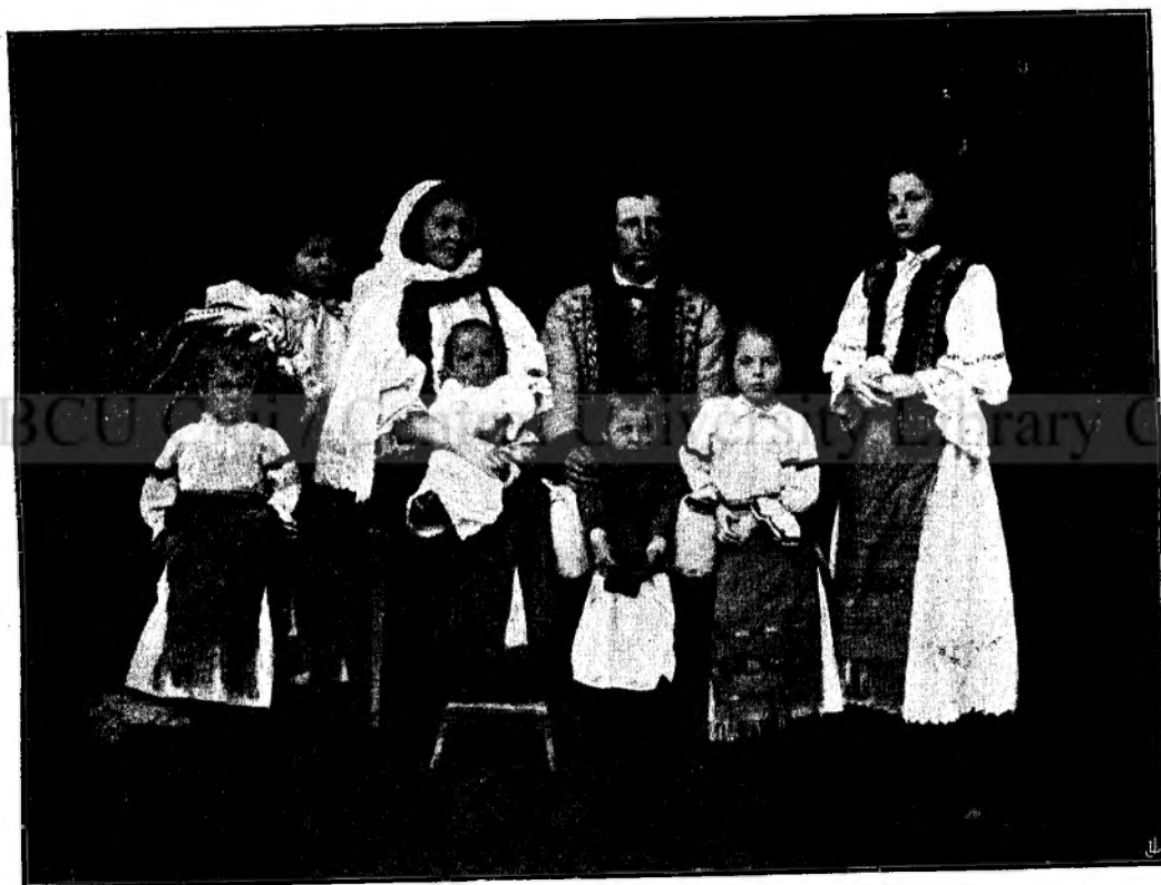
O familie din Bănat.