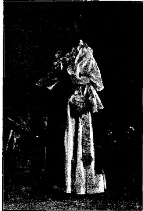
O coristă din Bistrița.