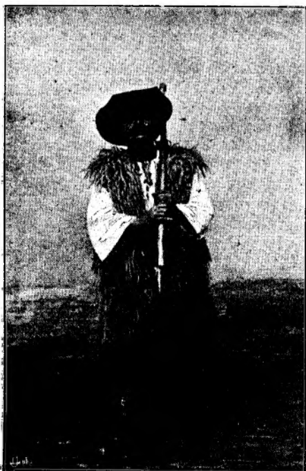
Un țeran din Sebeșul de sus.

Fața Steluței de culoarea trandafirului, într'o clipită a dispărut, luându-i locul o culoare palidă.