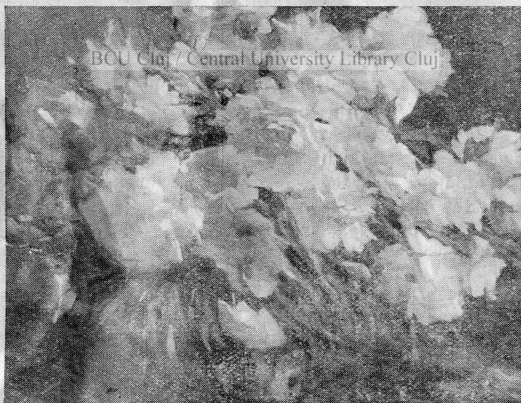
Corneliu Liuba : Bujori rose