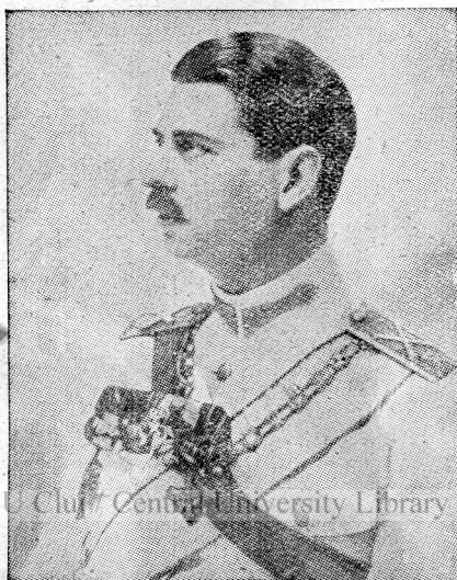
M. SA REGELE CAROL II.

... „Pace lumii Tale dăruiește, Bisericilor Tale, Preoților și prea Înălțatului Regelui nostru Carol al II-lea, ostașilor lui și tot poporului Tău; că toată darea cea bună și tot Darul desăvârșit de sus este, pogorînd dela Tine, Părintele luminilor“. (Rugăciunea amvonului).