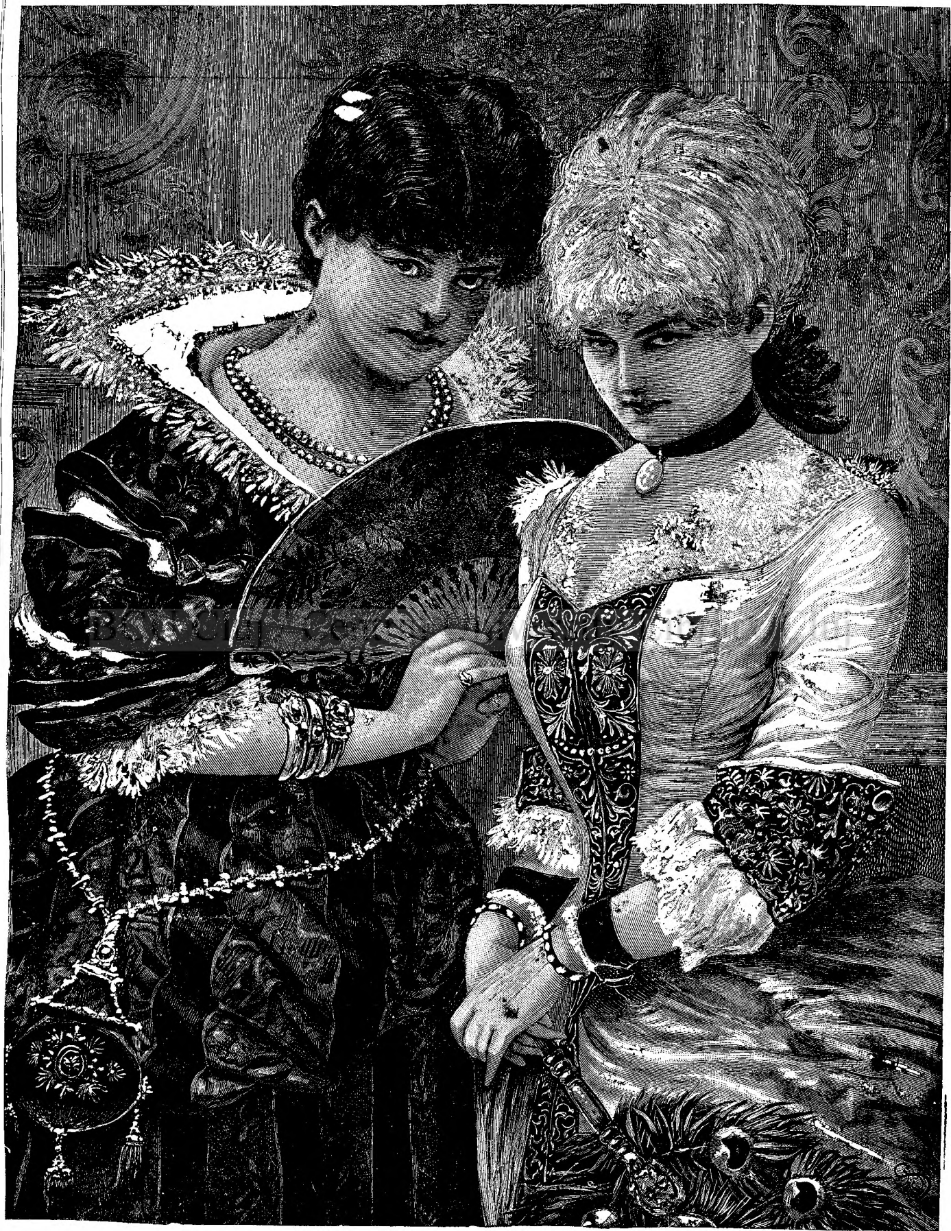
Care   mai frumoas  ?