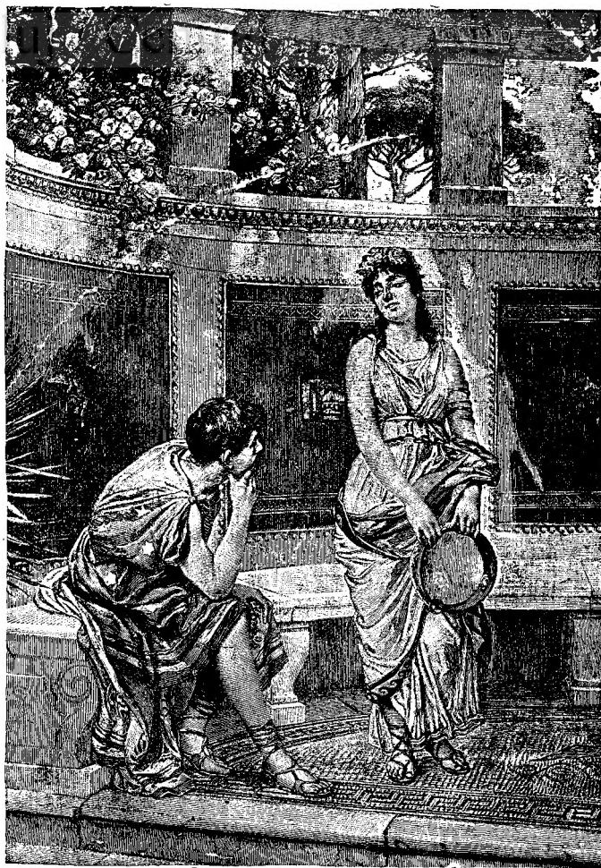
Cântăreața din harem.

Aici încă nimeni nu auzise pufăirea de monstru a locomotivei. Valurile sgomotului din lumea mare, când ajungeau în acest colț abătut, își pierdeau puterea cu care porniseră. Locuitorii acestei fericite comune se surprindeau cu noutăți învechite, își sfărmau mințile cu discutarea evenimentelor, peste care lumea trecuse