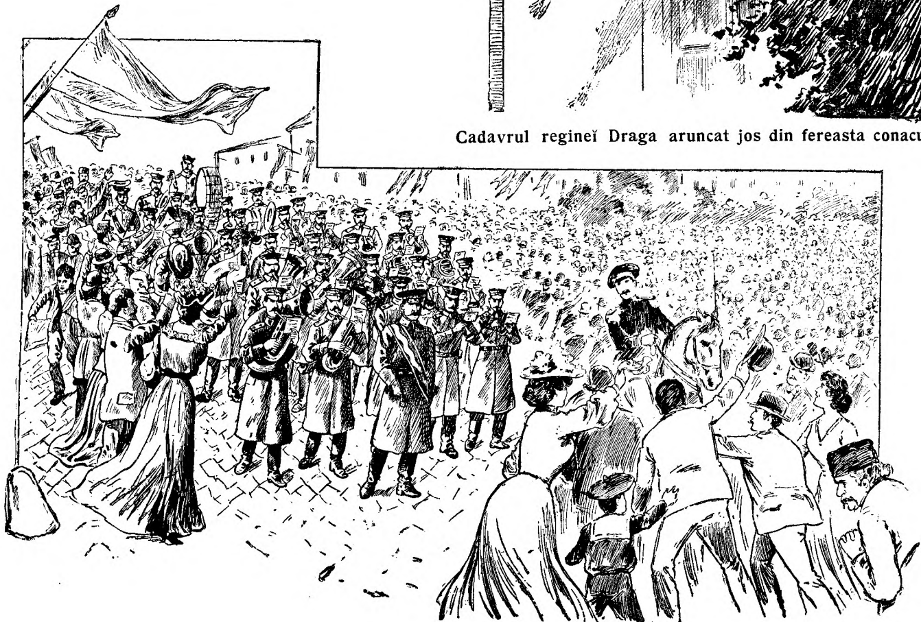
Conjurații serbează cu musică uciderile sevêrșite.