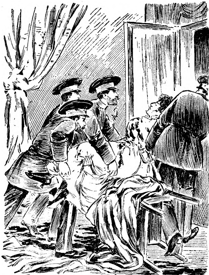
Conjurații iaă cadavrul reginei Draga să-l asvêrle afară.