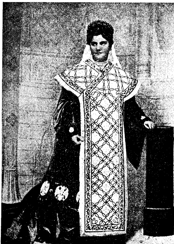
Regina Draga în costum de încoronare.

Și cum me căznieam să știu hotărît dacă e târziu ori timpuriu, fără să am pe cine să întreb, de odată m'a apucat uritul și m'am zis: Ce lucru prost să trăești singur! N'ai pe nime cine să te primească dacă sosești. De-aș avea o nevestă, știu că m'ar trage o gură de m'aș trezi la moment. Trebuie să me 'nsor.