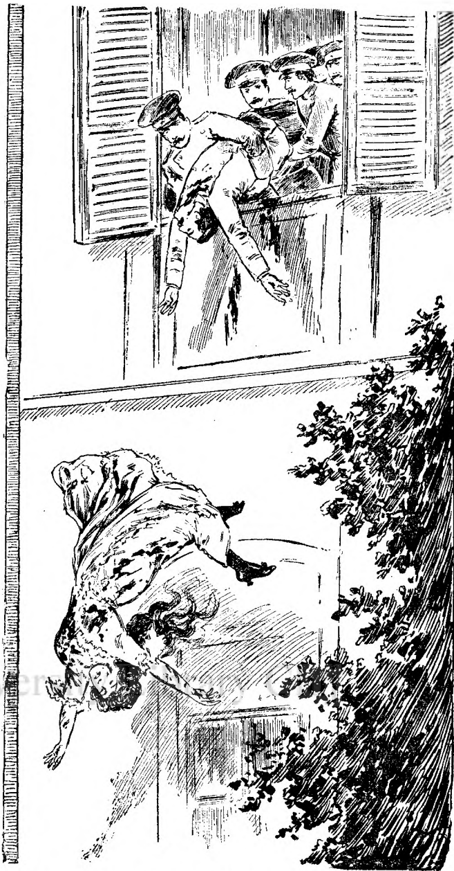
Cadavrul reginei Draga aruncat jos din fereasta conacului.