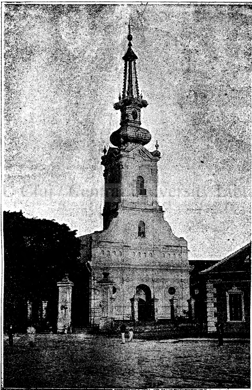
Bserica ort. or. română din Lipova.

Amėndoi umblaseră la şcoală 'n sat, când e- raú micí. Copilul erá mărişor şi tare, fetiţa erá mică. — Fetiţa se temea prin pădure, şi copilul în toată ziua o aşteptá cole la capul pădurii. El o tre- cea riul, el i prindea fluturi şi gândaci prin iarbă. Amėndoi culegeau bulbucí pe luncă, flori de mac prin holde şi scoici pe vale. Şi cole când se co-