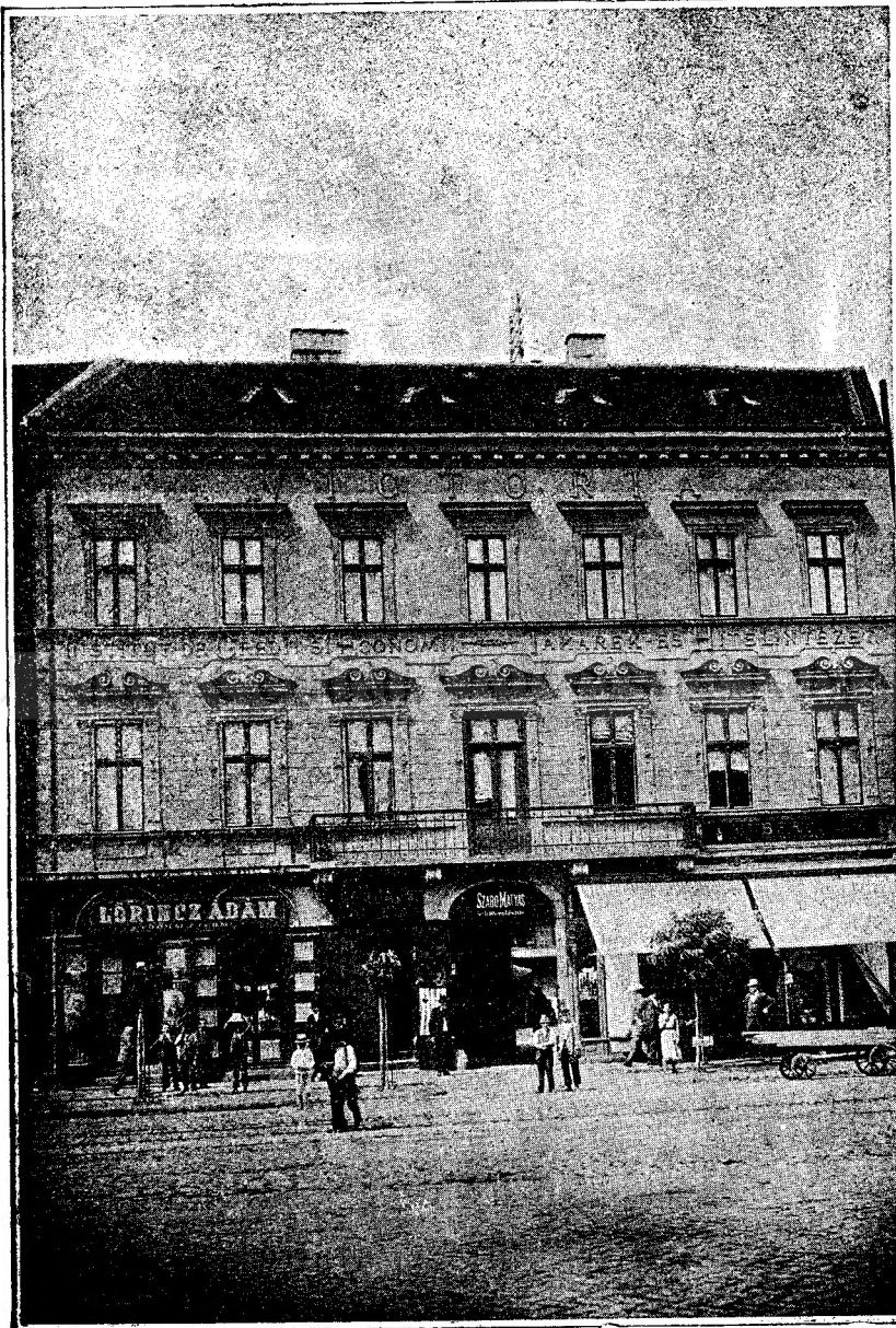
Institutul de credit și economii Victoria din Arad.

După creștință, coale seara, pe podmolul casei ședend singură sub crengile teiului, au început a-i spune frunzele. Frunzele și șoaptele.