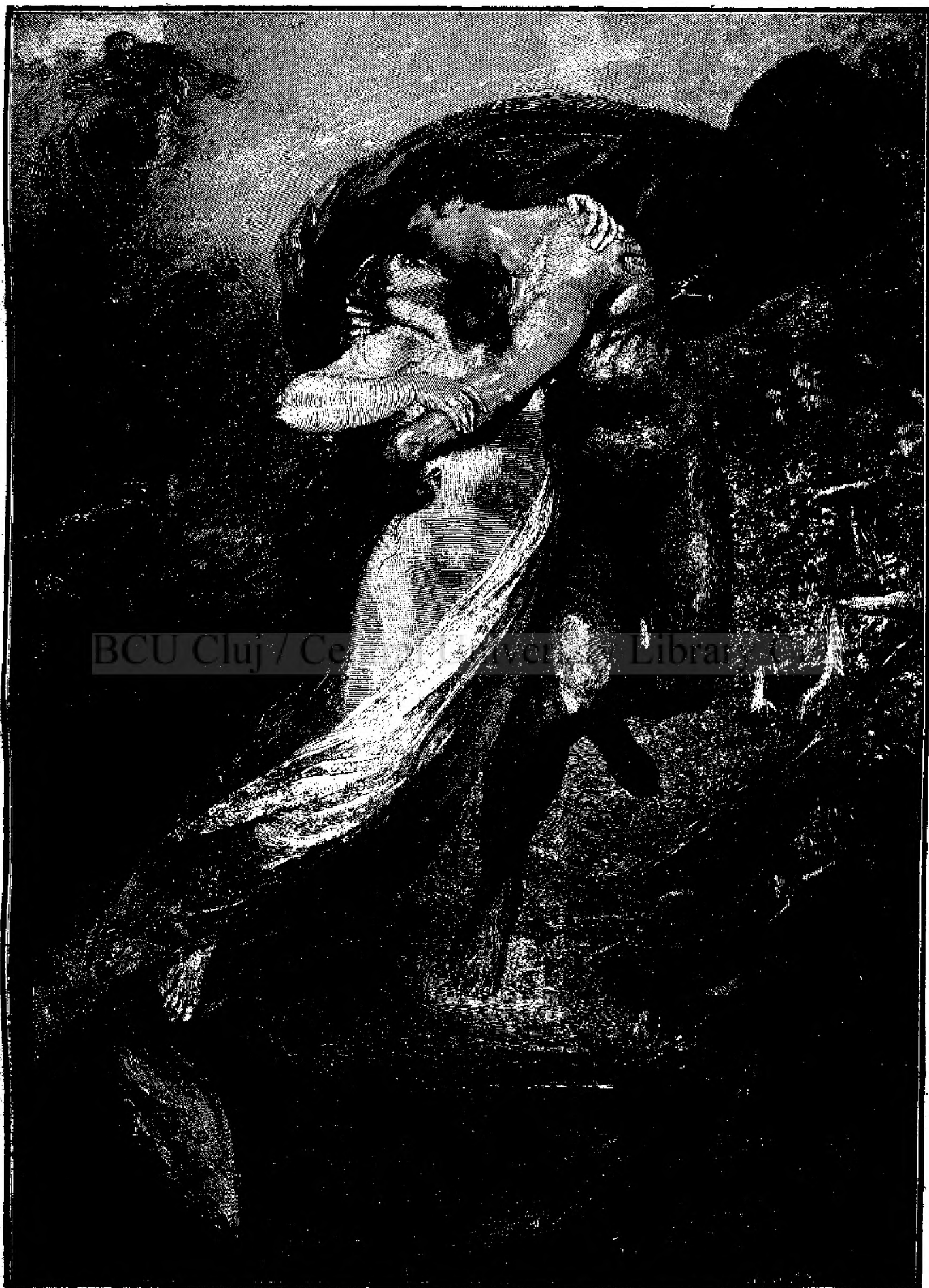
FRANCISCA DA RIMINI.