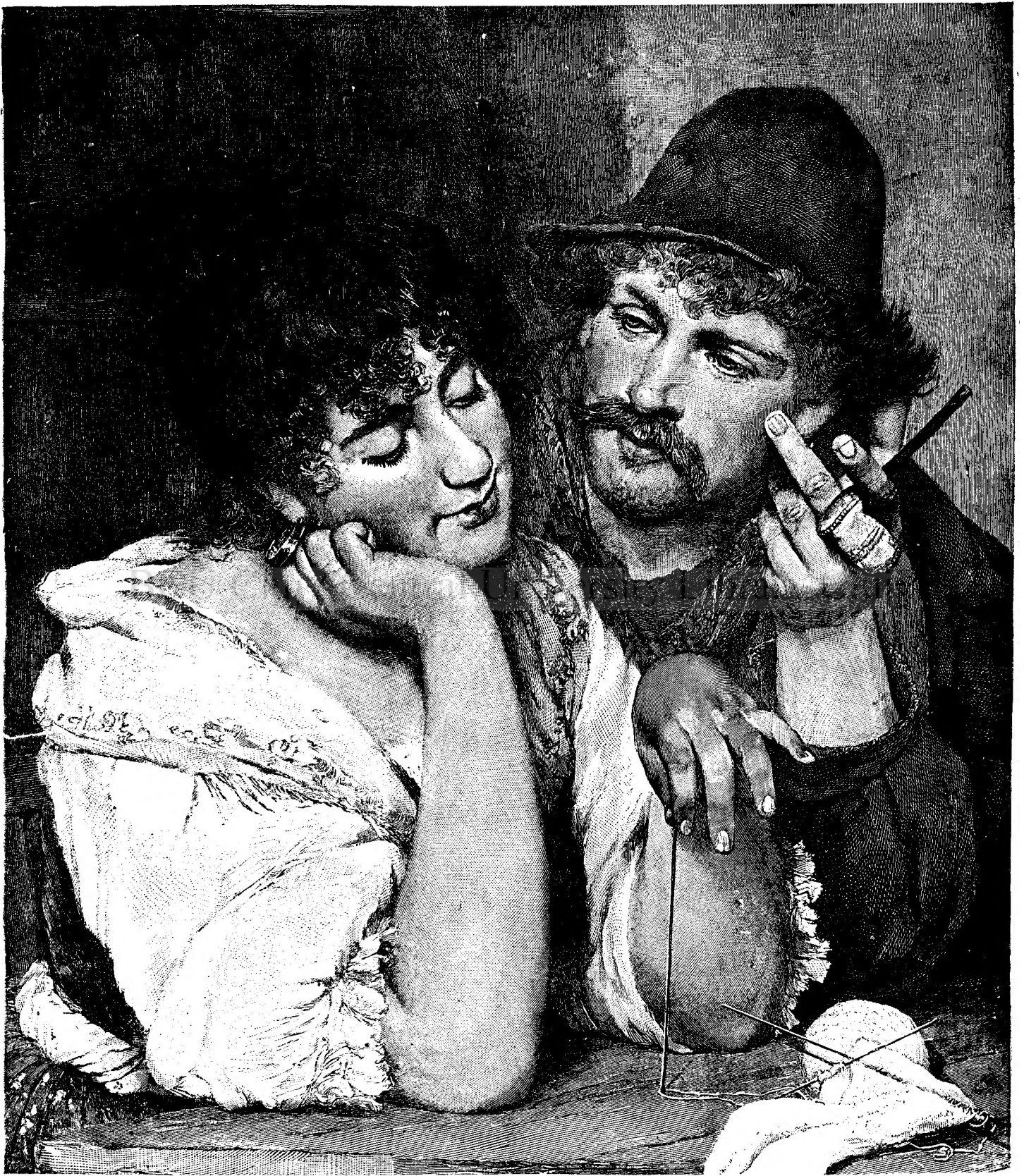
M O M E N T E D U L C I .