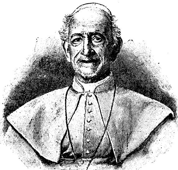
PAPA LEON XIII.

Irena (cu încordare.) Dar în mijlocul tumultului, tro-