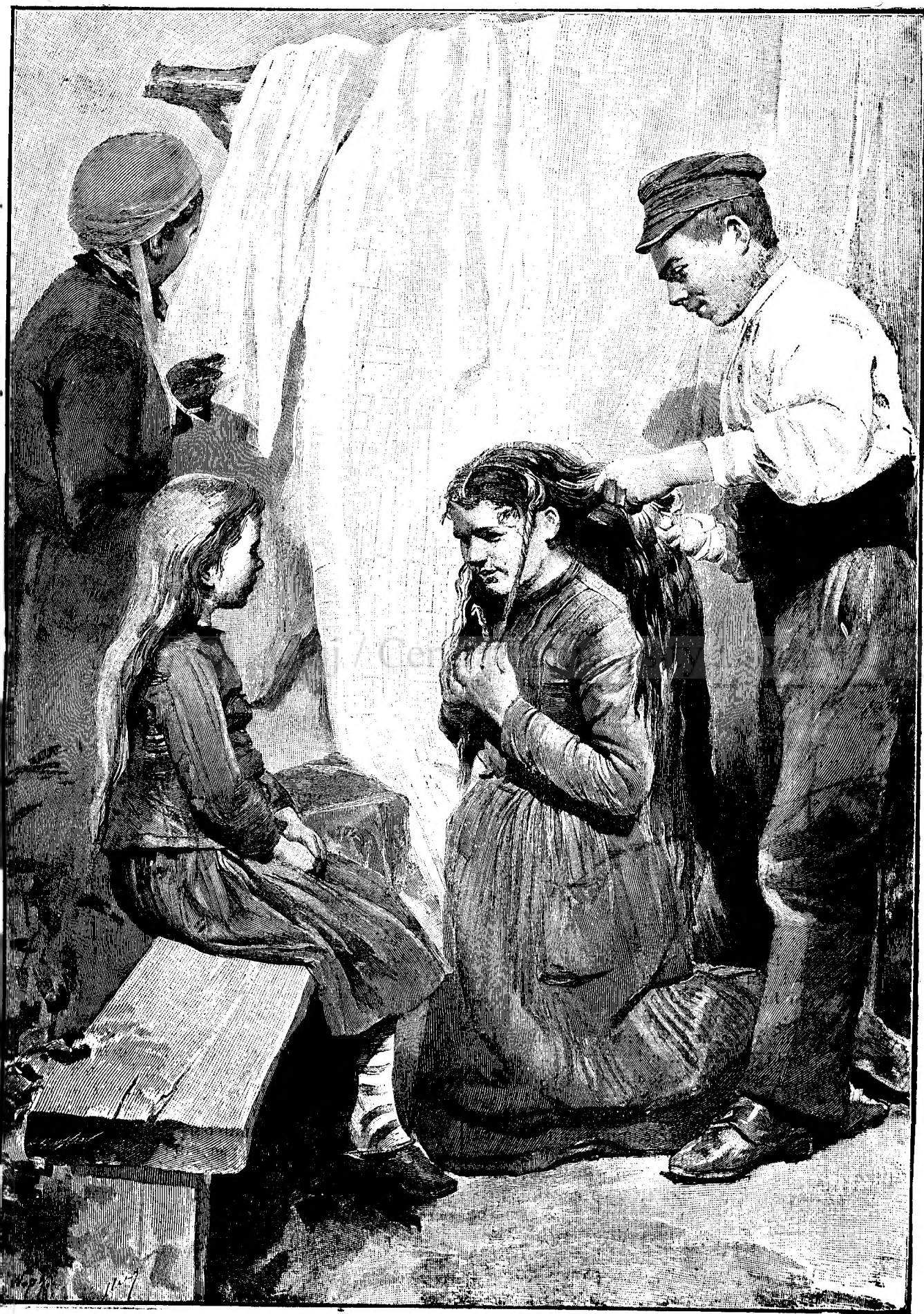
PRECUPETI DE PĒR ÎN FRANȚA-DE-SUD.