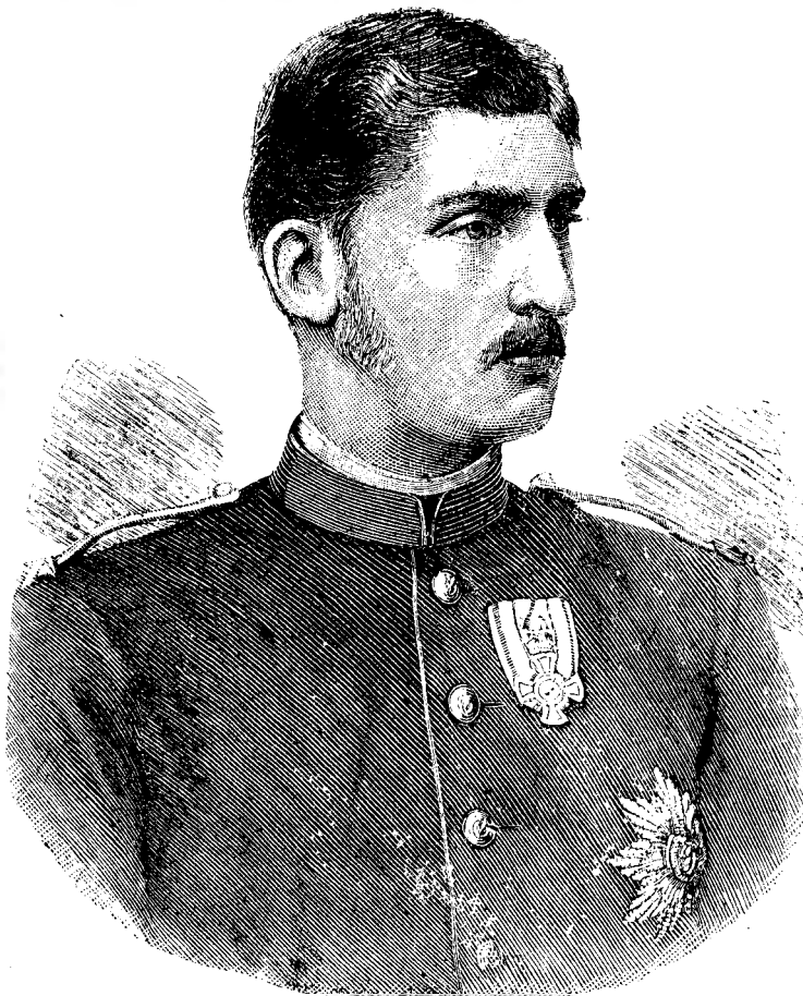
PRINȚUL FERDINAND AL ROMÂNIEI.

Bieții apostoli nu șcieau ce să se facă de necăjiți, căci erau foarte oboșiți de drumul cel lung, ce-l făcuse ziua întreagă prin nădușala cea mare; apoi eră la cina cea mare vremea, și ei nu-ș căpētă sălaș să doarmă și să se odihnească puțințel.