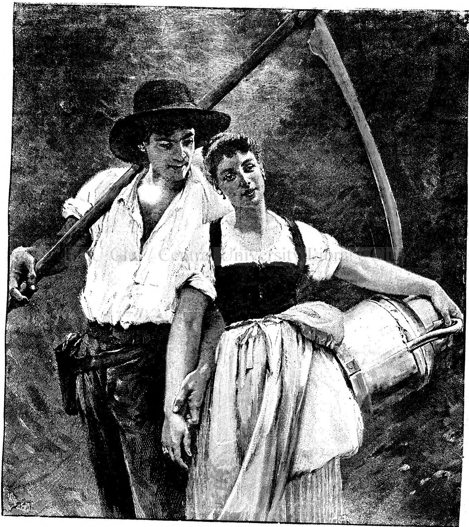
R e n t ó r c e r e a .