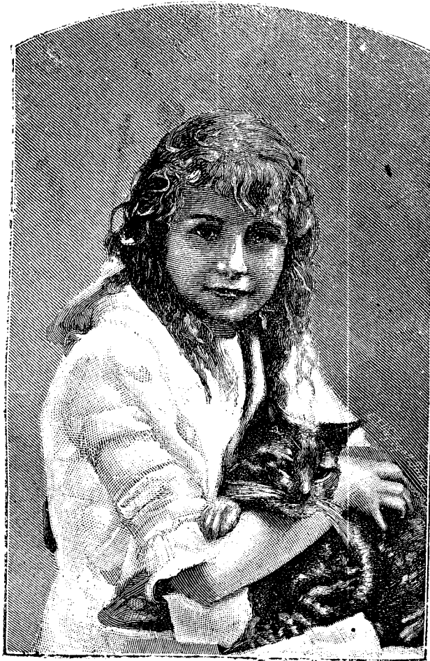
A m i c i a.

Ostașul ia pe fêta 'mpëratului de soție, făcënd un ospëț ca acela de puteai innodă in zamă lungă să le ajungă; zamă grósă tótă óse.