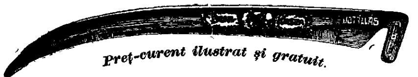
Preț-curent ilustrat și gratuit.

Coasa de oțel „Bur“ numai atunci este veritabilă, dacă pe mâner poartă gravată inscripția aceasta: W. G. Kőbánya , iar pe atul ei este tipăriia marca firmei cum arată figura asta: 1906-20