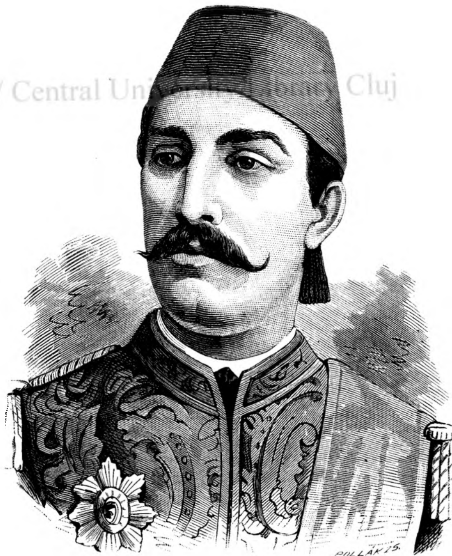
Tewfik I noul vice-rege al Egiptului.

Alegerea presiedintilor si a vice-presiedintilor numai pe câte unu anu — e numai o rapire de tiupu, ce deróga consolidării lucrurilor; si erá cu multu mai simplificatu lucru, déca — în locu de asiá numitii asesori — presiedintii secțiunilor erau totu-de-odata