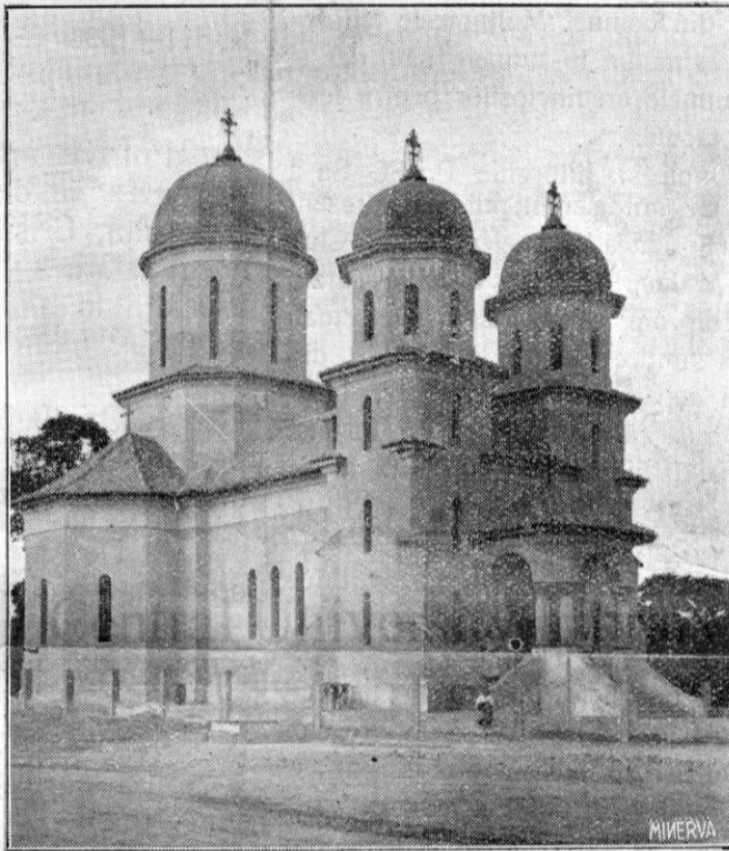
Biserica nouă din Vișoara