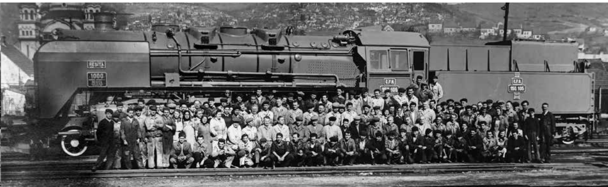
Führungskräfte der Lokomotivfabrik