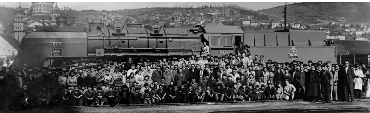
Die Belegschaft der Lokomotivfabrik

Neben den Fotografien, die 1955 von den Mitarbeitern aufgenommen wurden, stellt eine große Anzahl von Fotos eine Art Geschichte der im Laufe der Zeit in Reschitza hergestellten Lokomotiven dar, sowohl der Werkslokomotiven als auch der Tender verschiedener Typen.