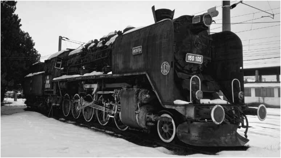
Lokomotive 150.105 im Lokotivmuseum Desch