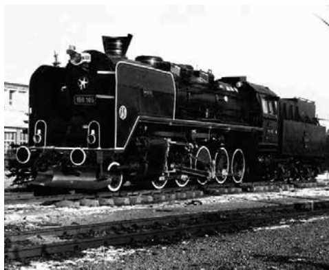
Lokomotive 150.105, Ansicht während der Verlegungsarbeiten. Desch (Dej) 1992, Foto FLORIN NAN.