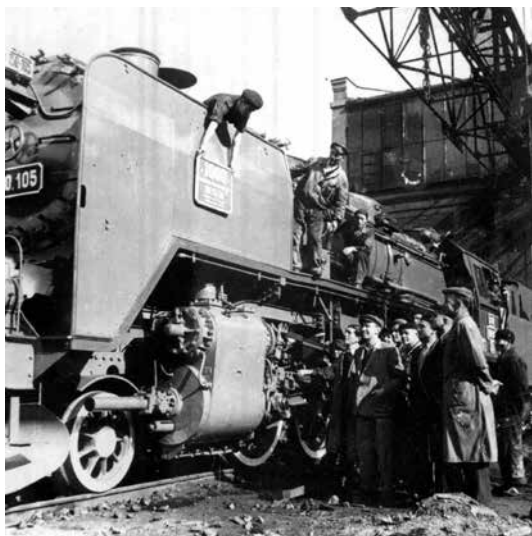
Reschitzaer Arbeiter feiern die Fertigstellung der Lokomotive mit der Nr. 1000.

ständig mit Maschinen aus den Reschitza-Werken ausgestattet. 1926 wurde in den Reschitza-Werken (Uzinele și Domeniile Reșița oder UDR) die erste Lokomotive der Baureihe 50.100 in Rumänien gebaut, die unter der Baureihe 50.243 registriert und „Regele Ferdinand“ (König Ferdinand) benannt werden sollte. Seit 1928 stellte das Malaxa Werk in Bukarest auch Dampflokomotiven her und wurde so zum Hauptkonkurrenten auf dem rumänischen Markt. Die hundertste Dampflokomotive der Malaxa Werke wurde 1930 in Betrieb genommen, trotz der Großen Depression, der schweren Wirtschaftskrise. Bis 1960 wurden in Rumänien 1207 Dampflokomotiven gebaut, davon 10 Normalspur- und drei Schmalspurlokomotiven, von denen 797 allein in Reschitza gebaut wurden. Die Dampflokomotiven, die bis 1980 bei der CFR im Einsatz waren, wurden zwischen 1980 und 1998 aus dem Verkehr gezogen.