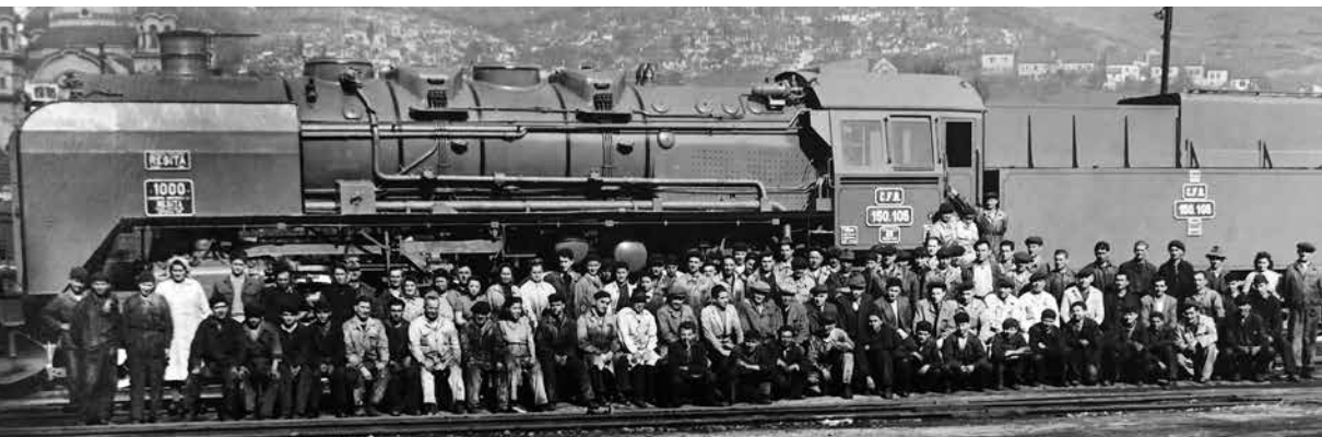
Die Belegschaft der Kesselschmiede