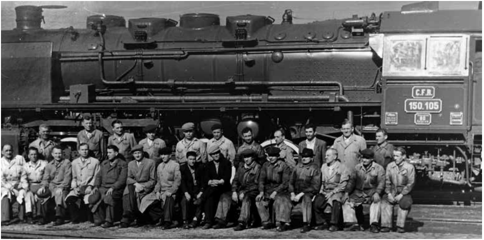
Führungspersonal der Lokomotivfabrik

Nach ihrer Ausmusterung wurden die meisten von ihnen als Material für Schrottplätze verwendet oder rosteten in verschiedenen Depots im Land, während andere, die mehr Glück hatten, zu „alten Damen“ der einschlägigen Museen wurden.