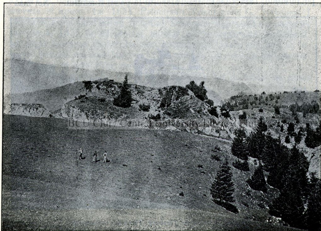
2. Cetatea Neamțului dela Podul Dâmboviței, în ruine.

După ce însă Ordinul acesta teutonic se supuse deadreptul jurisdicțiunii papale, ignorând pe episcopul Transilvaniei, iar în privința politică se geră ca autonom, încât regele aveă bănușală temeinică, că ei vor formă cu timpul un stat în stat, sau chiar o putere independentă, regele Andreiu II, în conlucrare cu fiul său Bela IV, la a. 1225 scoaseră deaci cu putere armată pe Teutonii, cari în a.