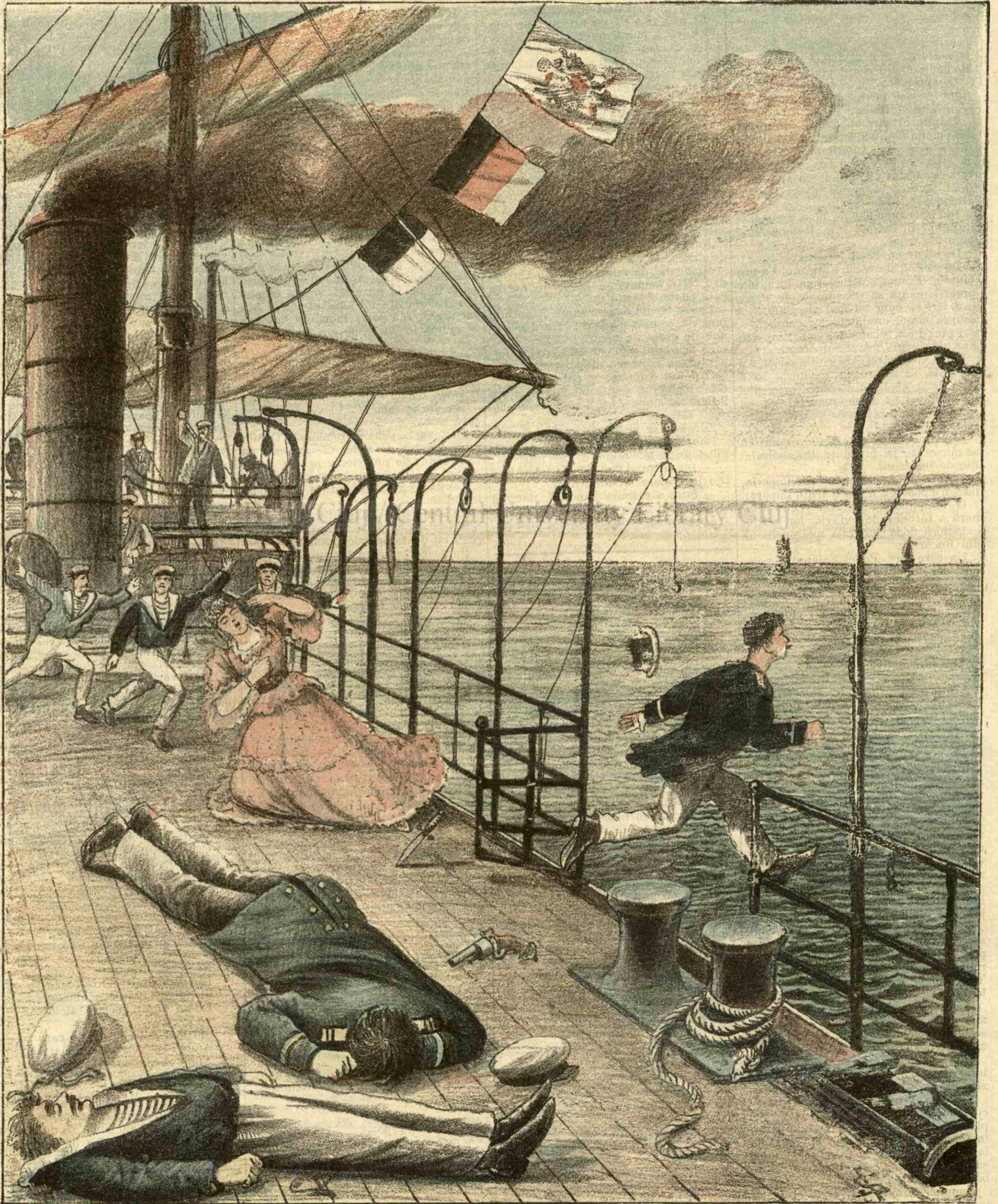
O tragedie pe Marea Neagră.—(Vezi explicația)