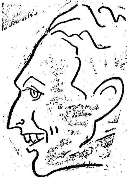
Korony, akitől legalább három gólt várunk

Vargen, Havas helyettese, ha ő játsszik az első meccsen akkor a clujiaknak más óvási okok kellett volna keresni