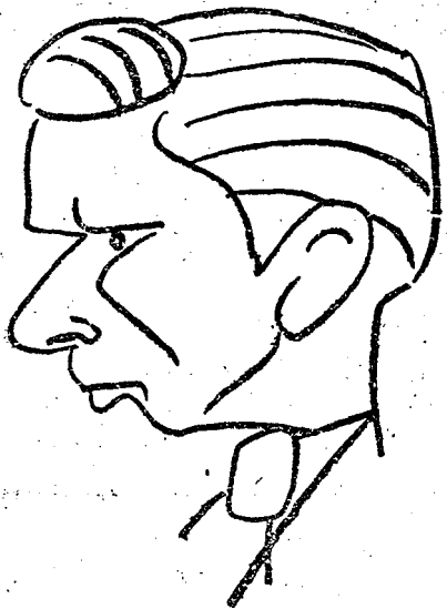
Bindea a fenegyerek

együttesével. A timisoarai együttes múlt vasárnap simán megnyerte bucuresti meccsét, azonban Oradeán már nehezebb dolga lesz. A Crisana-ban ugyan nem véd Püllök, mert sé-