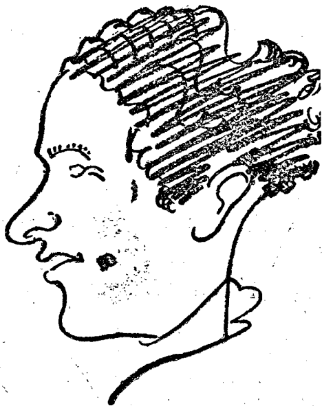
(Kohn Manó centerfedezet és császár)

Ezek a tárgyi okok, amelyek minden timisoarai sportembert arra fognak késztetni, hogy a TAC mellett drukkoljon