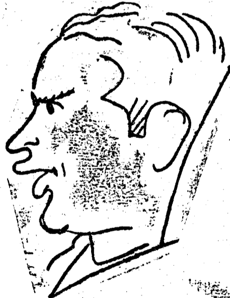
Possák a gólszák

mert meg kell mutatnia, hogy az első győzelem nem volt a véletlen, nem volt a bíró, nem volt a kapulák és nem volt a hibás igazolások, sem a 38. paragrafus. még kevésbé a 37. paragrafus műve, hanem kizárólag