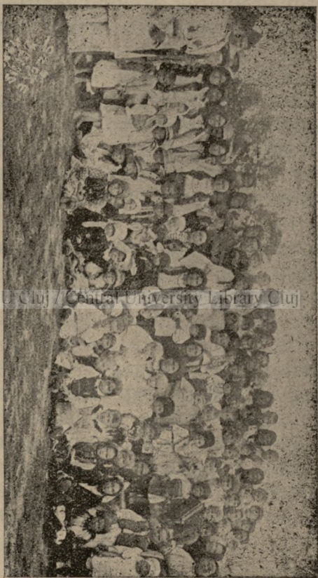
Expositia de copii aranjată de Reuniune în 16 Sept. 1923.

CU Cluj / Central University Library Cluj