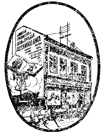
Casa de editură ALEXANDRU ANCA

CEA MAI MARE FIRMĂ românească în țară dela care să pot comanda recvisite bisericesti, cruci, potire, prapori, clopote de l.-a calitate dela 25—250 Kg. etc. Cereți ofertă!