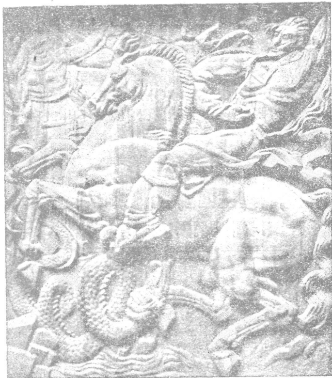
Sculptorul Romul Ladea :