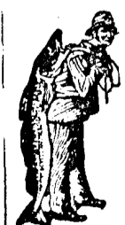
La cumpărarea Emulziei, luați sama să albiți marca de scutire albi Scott; Pescarului

DUPĂ COZACE este Emulziunea lui SCOTT cel mai potrivit mijloc pentru de a preveni alte morhuri. Cine folosește pentru prima oară Emulziunea-SCOTT, rămîne mirat, cit de repede reintregește puterile perdute. Renumele bun, de care să bucură Emulziunea-SCOTT pretutindenea, să bizzează deosebit pe ca-