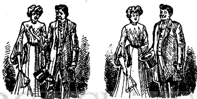
Înainte de întrebuințare. După întrebuințare.

Conținutul medicamentelor de mai jos sunt folosite de cei mai renumiți profesori și medici și sunt recunoscute de cele mai bune.