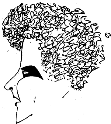
Desen de d. Drăgulescu