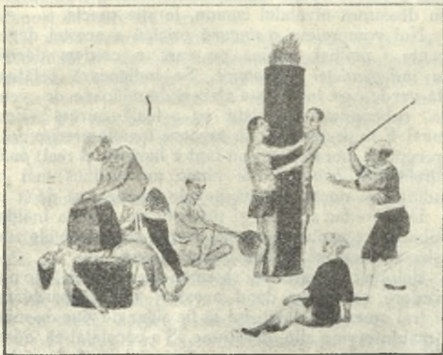
Planșa 6. — Burlanul încălzit și aplicarea greutateților pe pieptul condamnatului.

În ceea ce privește pedeapsa capitală aceasta era în genere de două feluri: tăierea capului și ștreangul. Un mare număr de pedepse așteptau după ele moartea, precum butucul, cușca și felurile mutilațiuni.