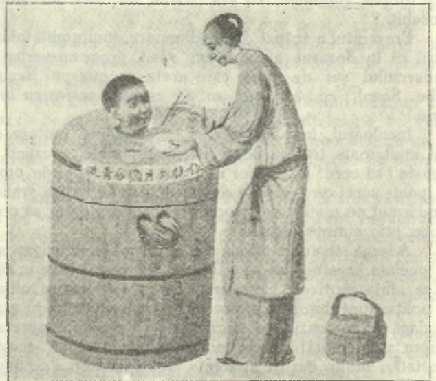
Planșa 3. — Alimentarea condamnatului.

Plimbarea condamnatului. Oricât ar fi acesta de puțin interesant, nu este așa că trebuie să i se dea puțință de a lua nițel aer, făcând câteva exerciții fizice. Administrația penitenciară a acestei țări fermecătoare, a știut să împace măsurile de siguranță cu grija sănătății prizonierilor, inventând aparatul simplu și practic, a cărui fotografie ne dispensează de orice descripțiune. (Planșa 2.)