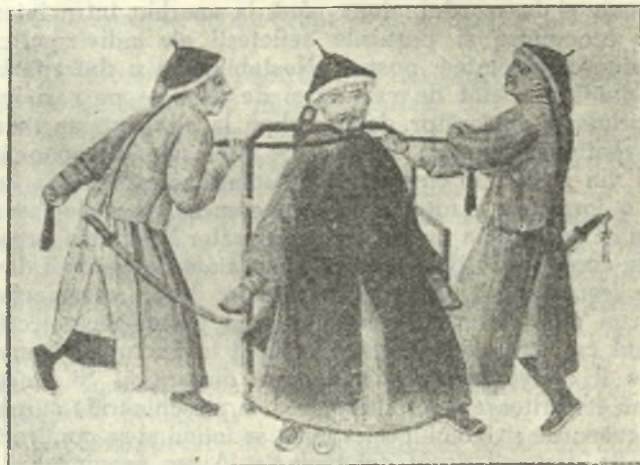
Planșa 8. — Lanțul de mătăsă.

Pedeapsa cu moartea, și se aplică în trei feluri: moartea prin strangulare, care e și mai puțin desonorantă; prin decapitare, și în sfârșit moartea prin tăiere în bucățele, pedeapsă care nu se aplică decât pentru crima de înaltă trădare, paricid, și crimă împotriva familiei imperiale.