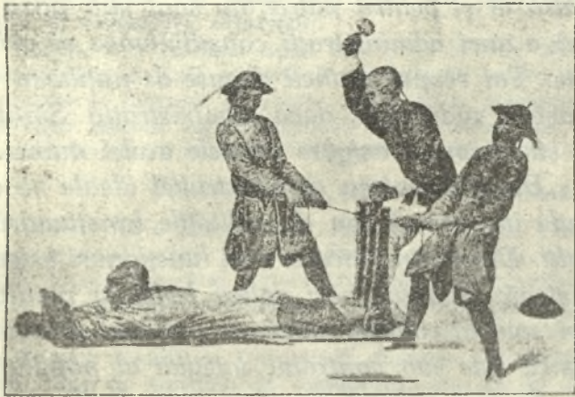
Planșa 1. — Tortura cu scop de a smulge mărturisirea de vinovație a bănuțului.

E cu puțință desigur, ca romancierul francez să fi exagerat; dar nu e mai puțin adevărat că chiar astăzi, chinezul este un barbar, în senzul strict al cuvântului, în represiunea criminală. El nesocotește cu totul viața omenească.