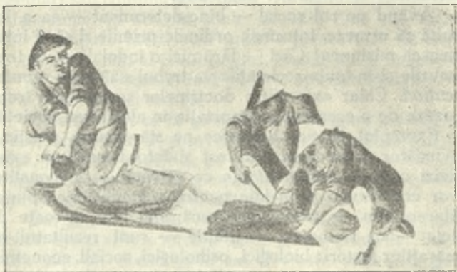
Planșa 5. — Jupuirea și tăierea tendoanelor, condamnatului ce a încercat evadarea.

Condamnatului ce ar fi încercat să fugă din închisoare, sustrăgându-se pedepsei, i se tăiau pur și simplu tendoanele picioarelor. Fără vreo anestezie prealabilă, călăul înarmat cu un cuțit tăios, îi tăia toate tendoanele, și toți mușchii părții inferioare a gambei (planșa 5). Spre a opri hemoragia și a pansa rana, el aplica un tampon special, numit șanam. Statistica nu arată câți prizonieri supraviețuiau acestui supliciu barbar. Se poate presuma însă că șanam-ul nu conținea acele minunate virtuți terapeutice de a lipi arterele și de a împiedeca infecțiunea rănei.