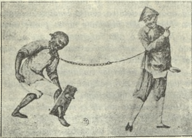
Planșa 2. — Preumblarea condamnatului.

Se poate ușor deduce din exemplul acesta proaspăt, cece era represiunea în vremurile mai îndepărtate, pe când China nu primise încă influența civilizației europene