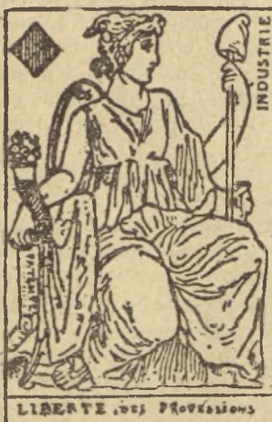
LIBERTÉ DES PROFESSIONS