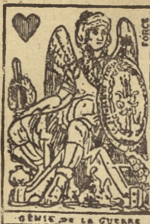
GÉNIE DE LA GUERRE

Aplicațiunea aceasta s'a făcut în cursul secolului XV. Germania sta în fruntea fabricațiunii și orșul Uhlm deveni un centru important în această direcție.