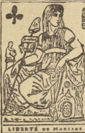
LIBERTÉ DE MARIAGE