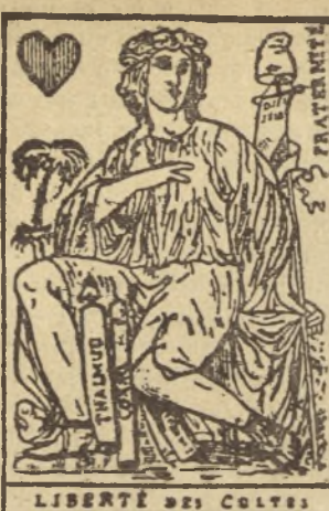
LIBERTÉ DES CULTES