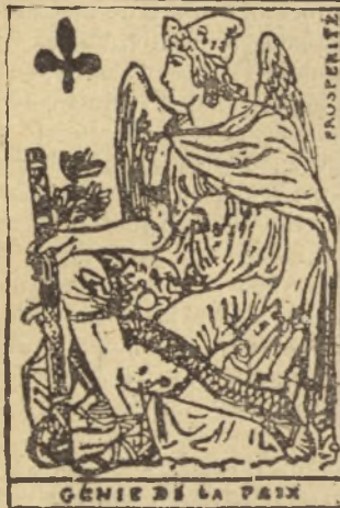
GÉNIE DE LA PAIX