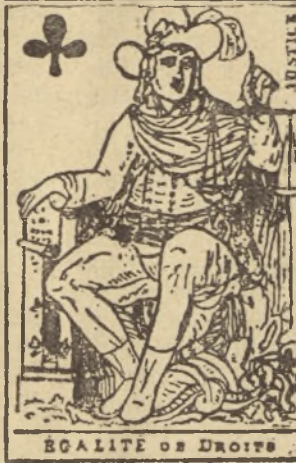
ÉGALITÉ DE DROITS