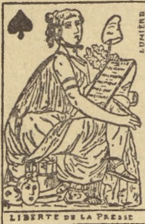
LIBERTÉ DE LA PRESSE