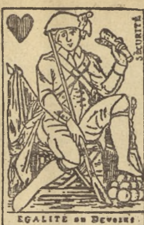
ÉGALITÉ DE DEVOIRS