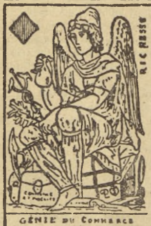
GÉNIE DU COMMERCE