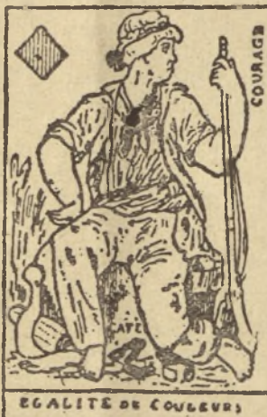
ÉGALITÉ DE COULEURS