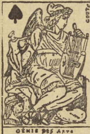
GÉNIE DES ARTS