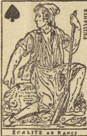
ÉGALITÉ DE RANGS