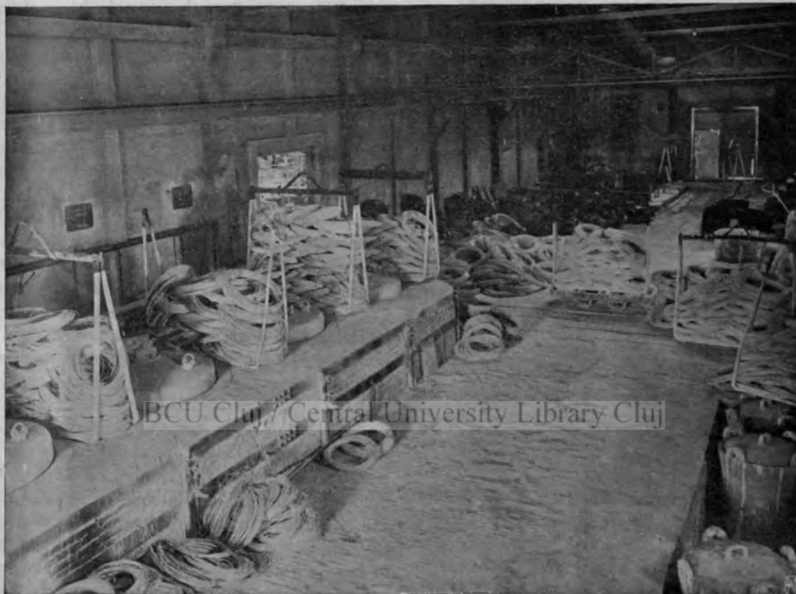
Industria Sârmei : Roadele muncii

Solicitudinea pe care o dă fabrica viitorilor meseriași se vede, nu numai în creșterea lor ca meseriași și ca buni români, dar și în confortul care