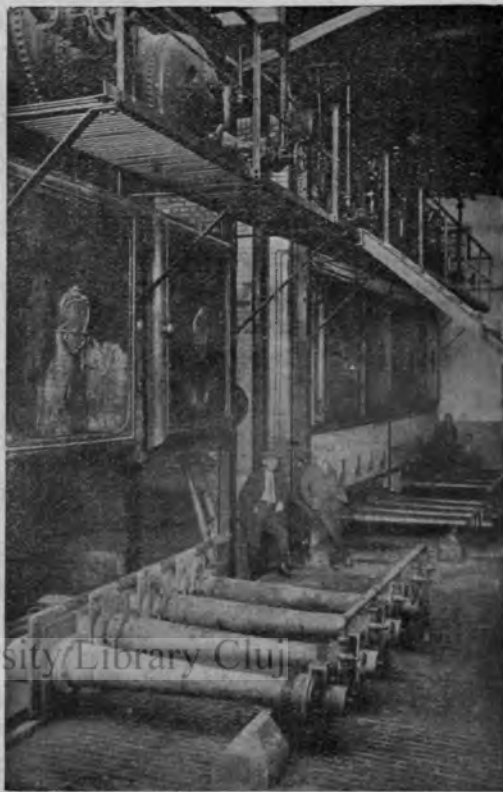
Marea sală a cablurilor

Este aici o mare învățătură, care credem că va fi utilizată de noua directivă a vieții de stat. Trebuie