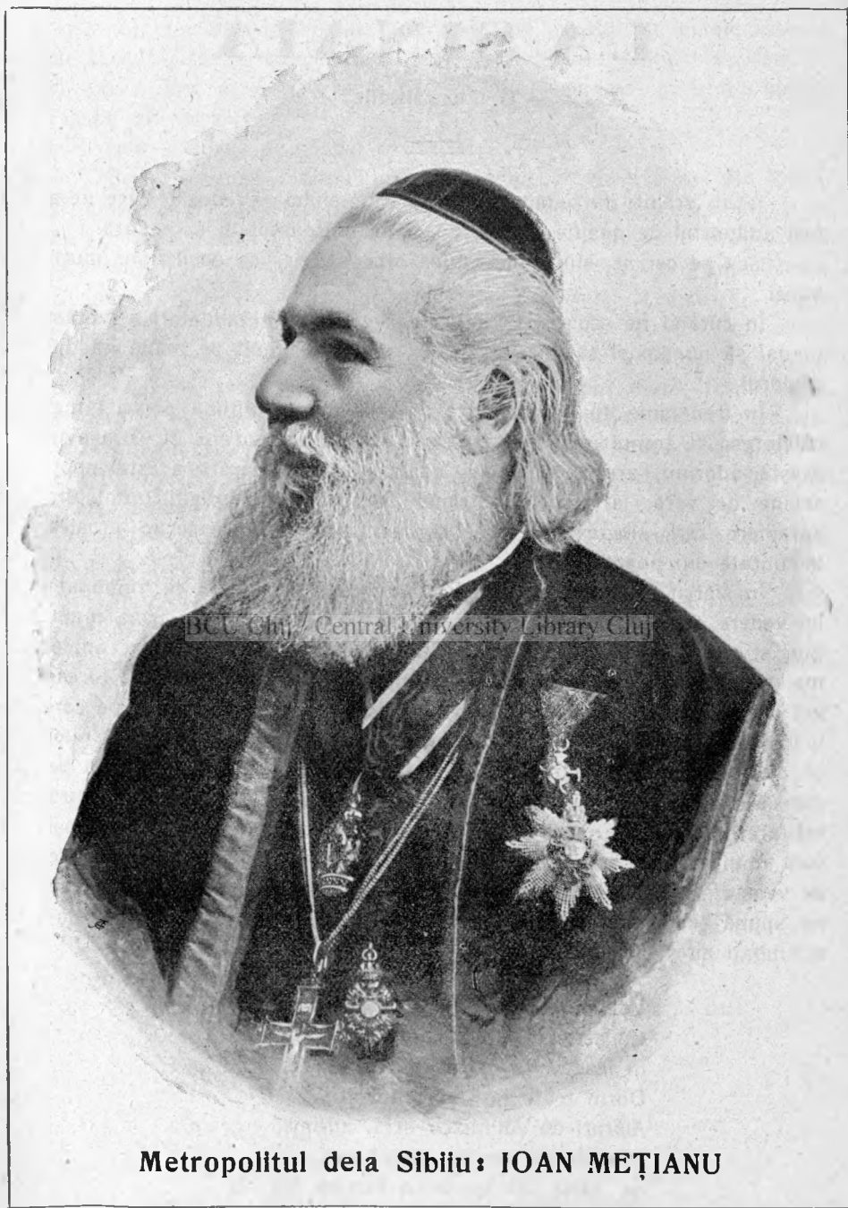
Metropolitul dela Sibiu: IOAN MEȚIANU