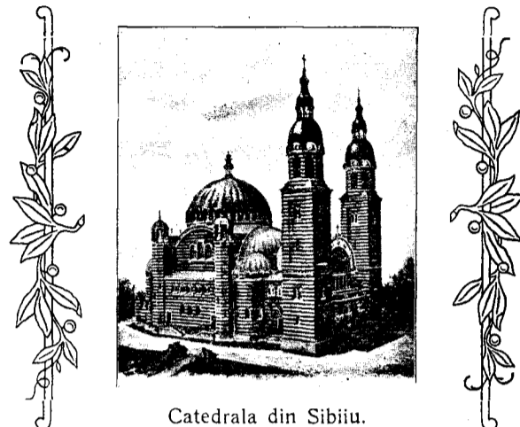
Catedrala din Sibiu.

Așa vrea D-zeu și așa trebuie să vrem și noi. Dar multe pedeci ni-se pun în cale și prea multe păcate ne opăcesc în nizuințele ce le punem spre luminarea și spre păstrarea neamului nostru. Tocmai de aceea și învrăjbirile, cari ne destramă, ne immoaie și ne slăbesc puterile și ținerea frățască la olaltă, trebuie să le stărpim urma și să le săcăm îsvoarele. Luptătorul își deprinde iscusința și brațul zi de zi. Noi încă trebuie să ne deprindem mințea învățînd cele bune și muncind cu străduință. Primul și cel mai desăvîrșit dascăl al minților și al sufletelor noastre e cartea, e înțelepciunea, neamului nostru. În cartea noastră