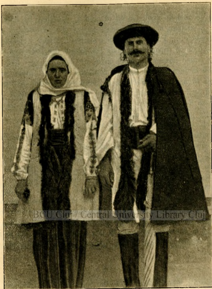
Doi țărani români din Straja.