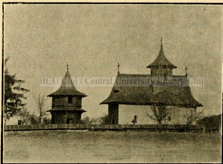
Biserica din Pătrăuț pe Suceavă (din depărtare).

mi s'a întâmplat la felurite prilejuri să întreb pe cutare fecior sau fată: Cetit-ai cutare sau cutare carte dela cabinet? Răspunsul a fost totdeauna că cel întrebat a strins din umeri. Unde sânteți voi cărturarilor bătrâni și voi părinților știutori de carte să vă rădicați glasurile și să-i povățuiți pe tinerii voștri, că s'a trecut de mult vremea hăulitului vecinic, căci azi trăim în timpul de groază al paserilor noastre călătoare la America, în timpul potopului cumplit al minciunii, înșelăciunii și încălecării celor slabi de cătră cei hâtri și vicleni și fără suflet și fără Dumnezeu! De ce nu li deschideți tinerilor voștri ochii, că ei numai cu cheltuiala unui singur joc și-ar