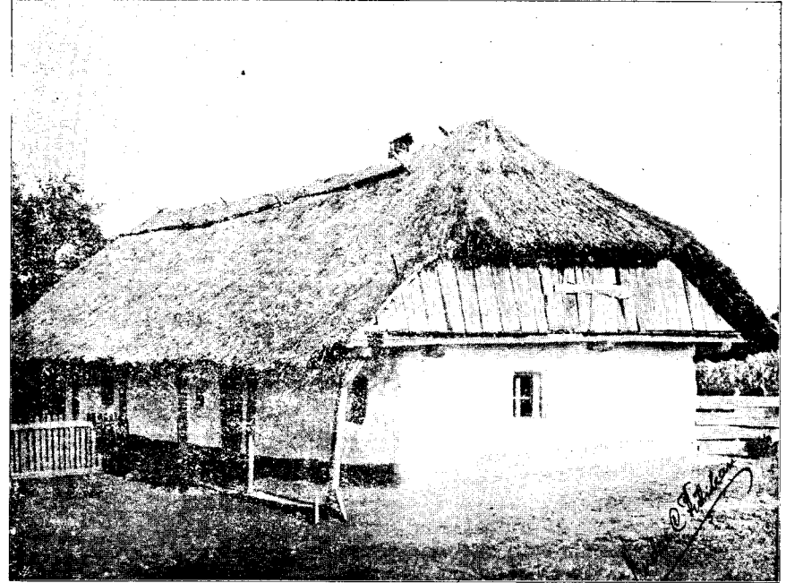
Casa nașterii lui G. Barițiu.

Trenul e îndesuit de lume — românească! Clasa a II-a, ca și clasa I., e plină de călători ro-