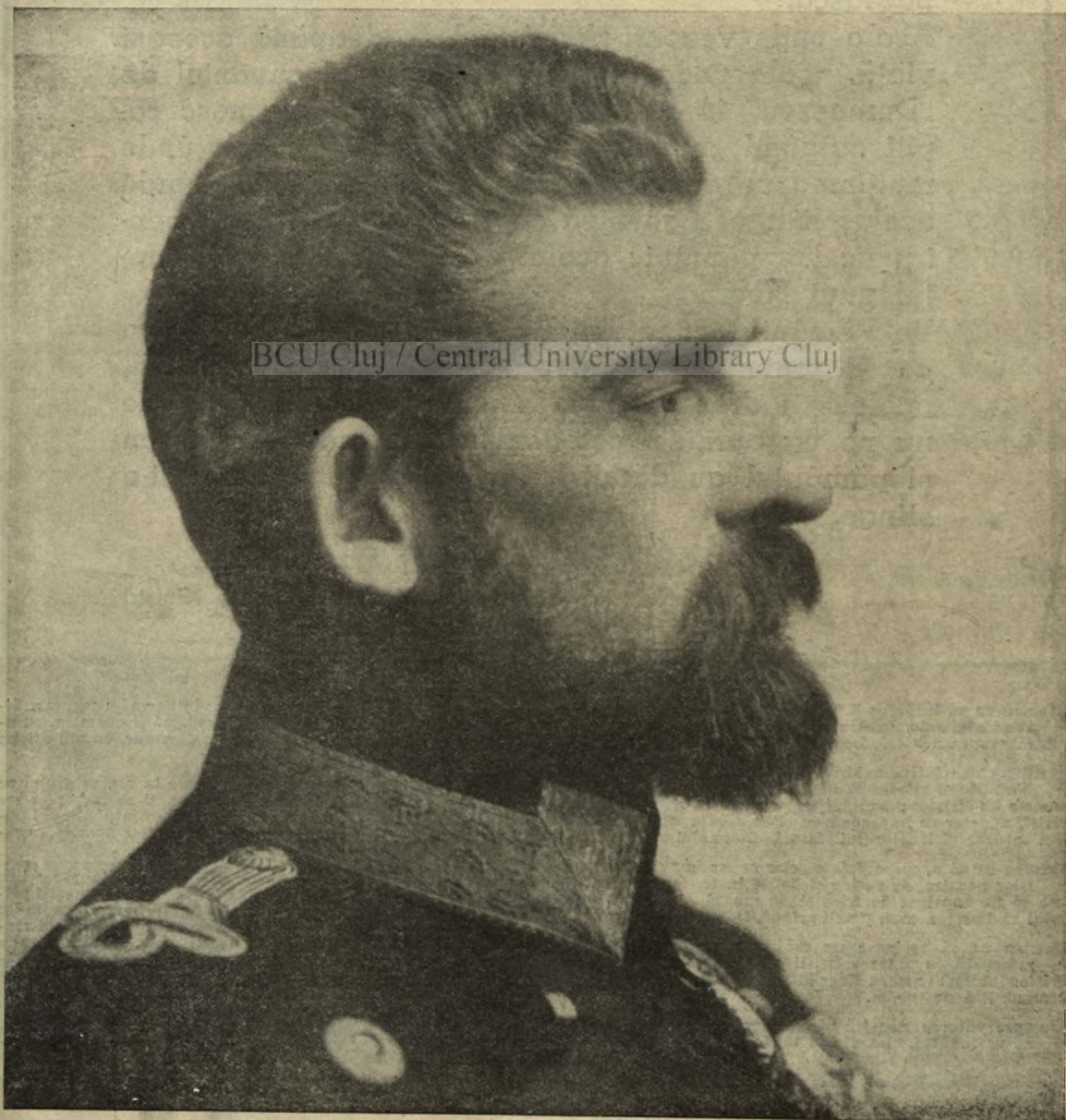
REGELE FERDINAND I

Redacția și Administrația BUCUREȘTI I Strada Edgar Quinet Nr. 6