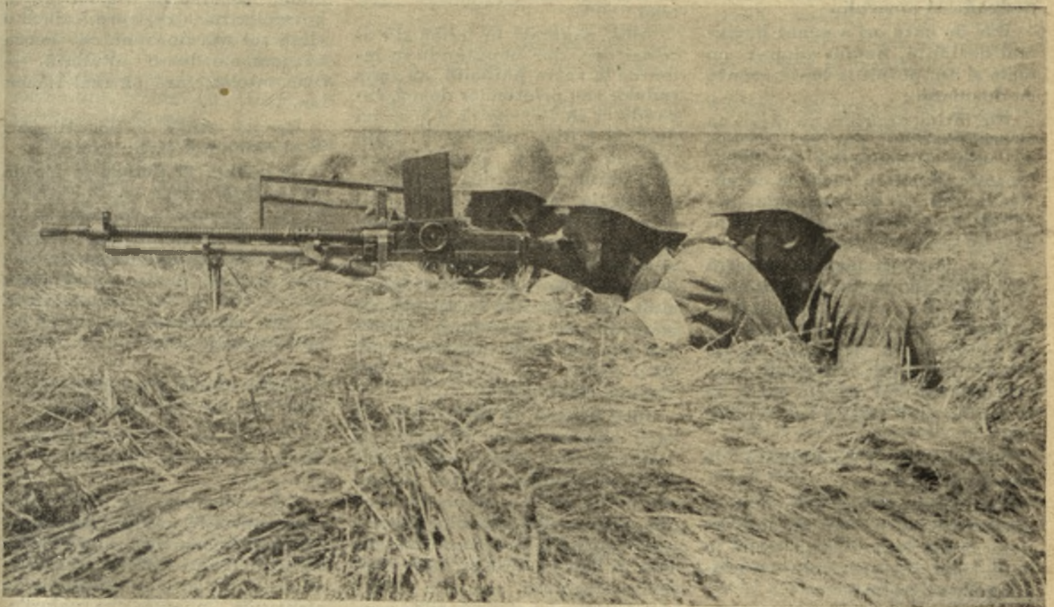
Pe frontul din Ucraina, pușca-mitralieră sprijinind înaintarea infanteriștilor.