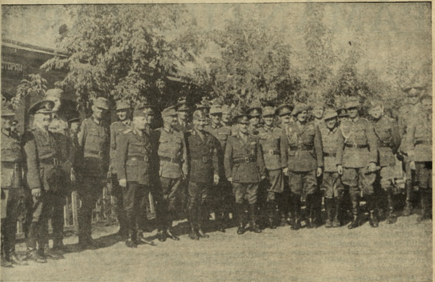
BCU Cluj / Central University Library Cluj Ofițeri germani și români, după o masă camaraderescă, undeva pe frontul dintre Bug și Nipru.