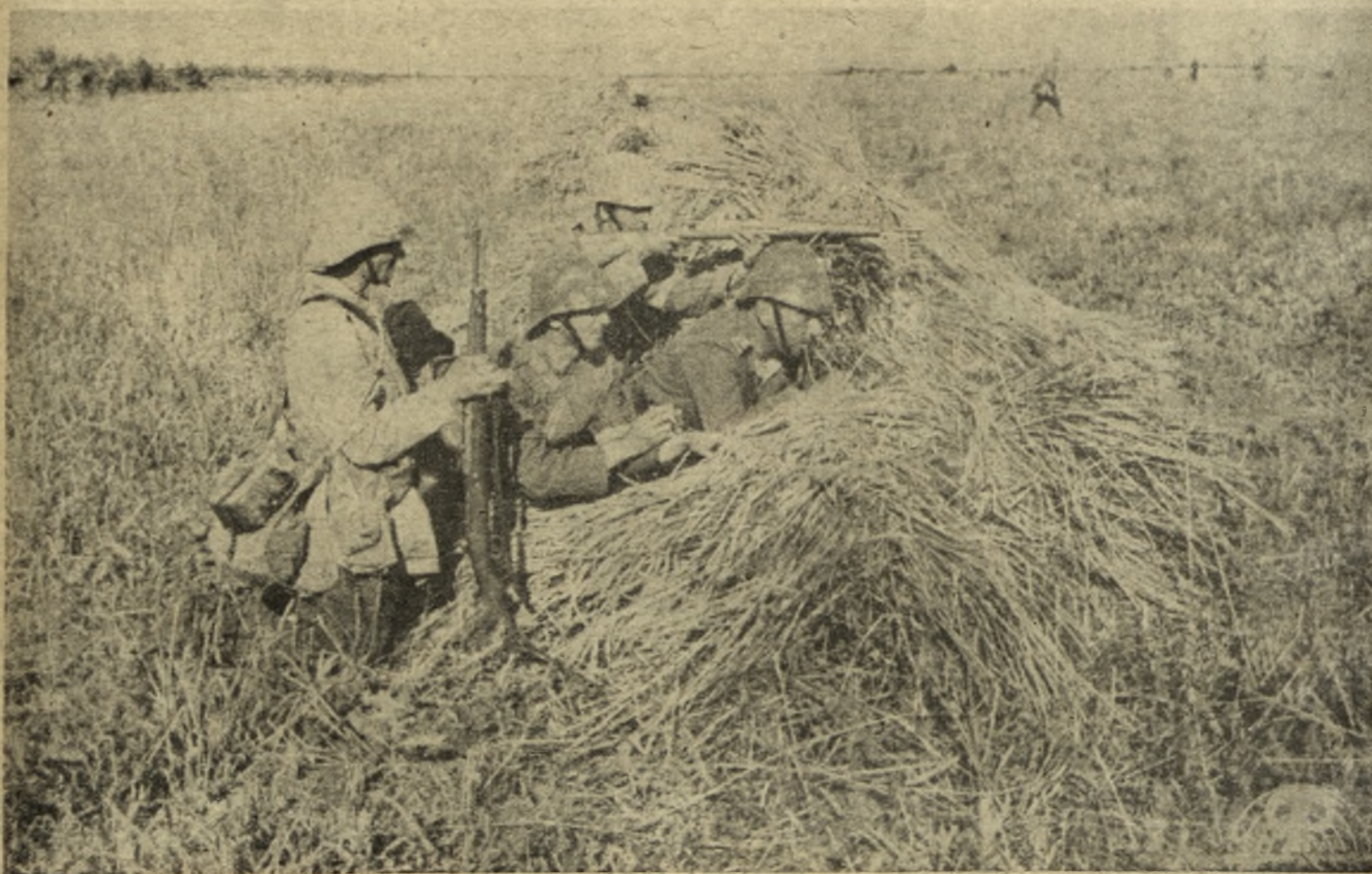
Infanteriști români, în timpul unui atac pe frontul din Ucraina.