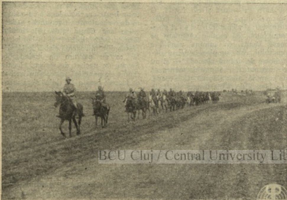
Pe câmpiile ucrainiene, trupele noastre inaintează tot mai departe.

De o mie de ani am privit la Răsărit cu groază. Toate hoardele Asiei pe aici au năvălit dar s'au sfărâmat de piepturile noastre de oțel. Strajă neadormită am fost noi aici pentru toate neamurile Europei. Glorioasa și viteaza armată germană, în acest război sfânt a distrus bolșevismul. Europa să nu uite aceasta.