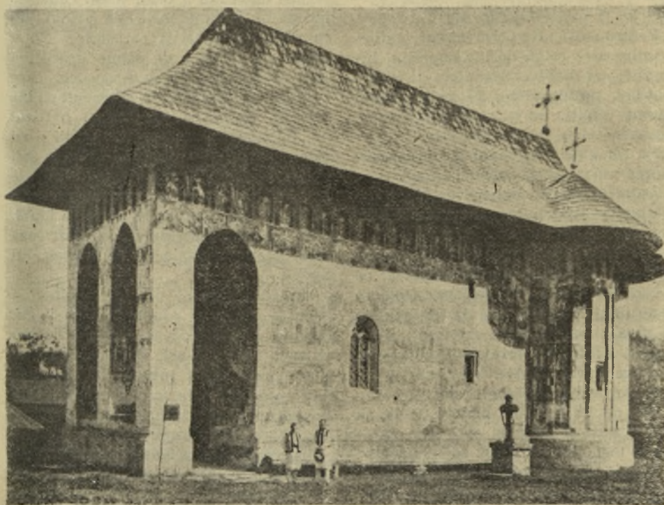
Mănăstirea Gura Humorului Bucovina.

sfântă Datină și o poruncitoare in- vățătură națională.