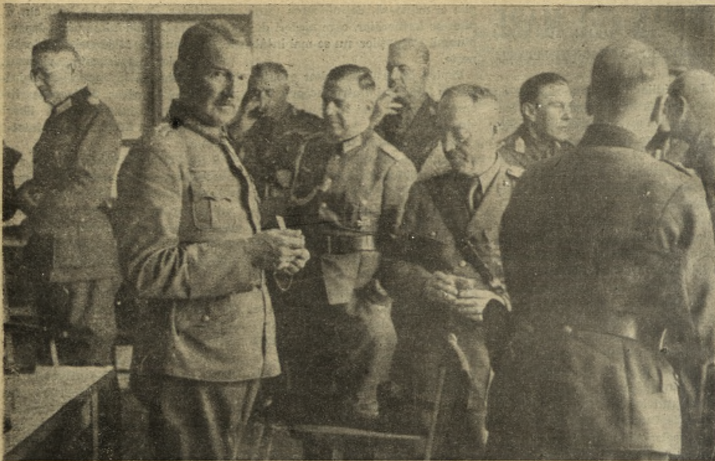
La un comandament de pe frontul româno-german, Mareșalul Antonescu a înmănat generalilor von Schobert și Hansen înaltele decorațiuni ce le-au fost conferite de către M. S. Regele.