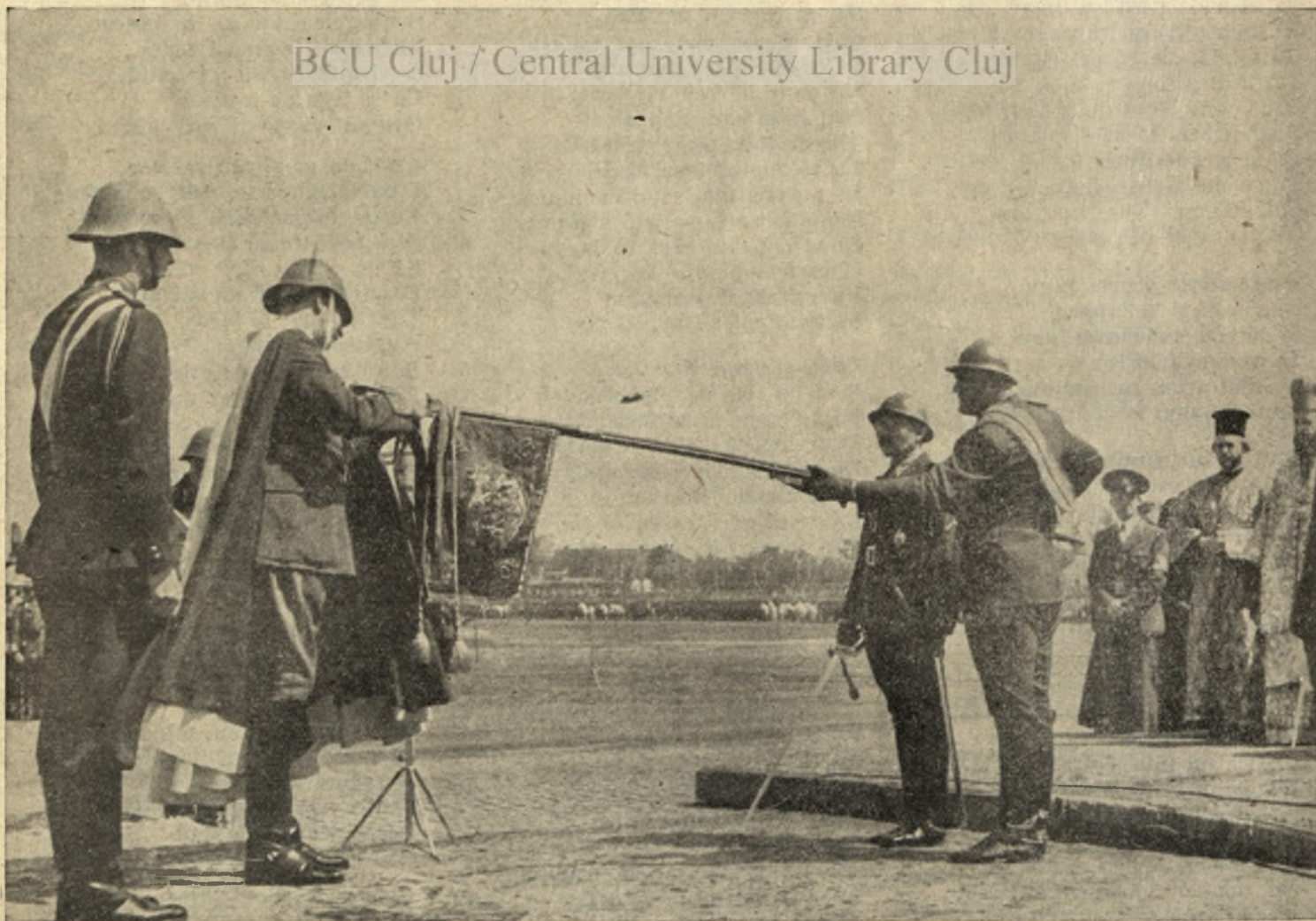
M. S. Regele, însoțit de Marele Voevod Mihai decorează drapelul unui regiment.

Se statornicesc drepturile țărânimii pe pământul ce-l stăpânește prin expropriere.