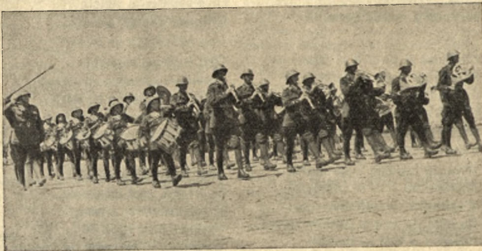
Defilarea dela 10 Mai

În studiile sale istorice, publicate acum câțiva ani în Revue des Deux Monde, d. Maurice Paleologue, fostul ambasador al Franței la Petrograd, ocupându-se de războiul întreprins în 1877 de ruși și de români, în Balcani, reamintește un fapt interesant: intervenția salvatoare a armatei ro-