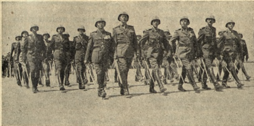
Defilarea dela 10 Mai

Libertățile și drepturile unui popor nu se proclamă, ci se câștigă prin lupte și jertfe. Generațiile trecute au înțeles ce le impune datoria lor.