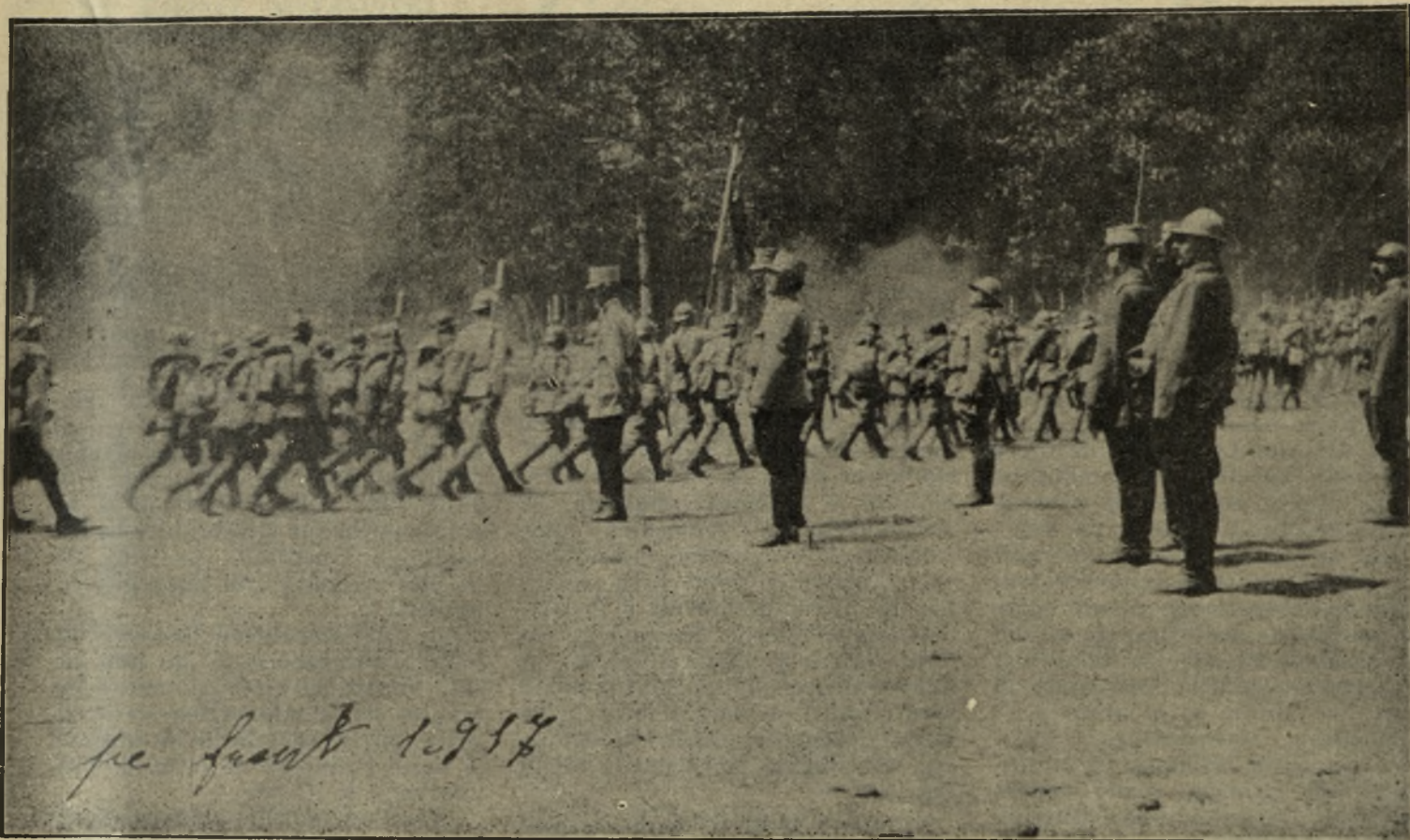
Mareșalul Averescu și Generalul Văitoianu pe frontul dela Mărăști în anul 1917