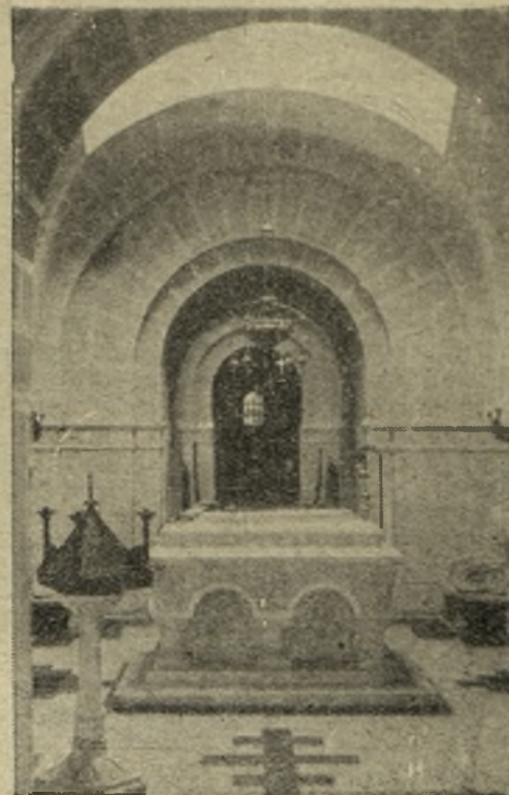
Vederi din interiorul Mausoleului dela Mărășești.