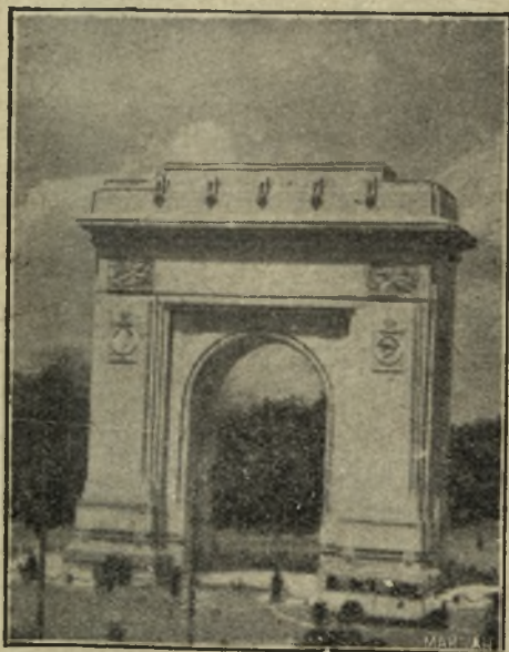
Arcul de triumf