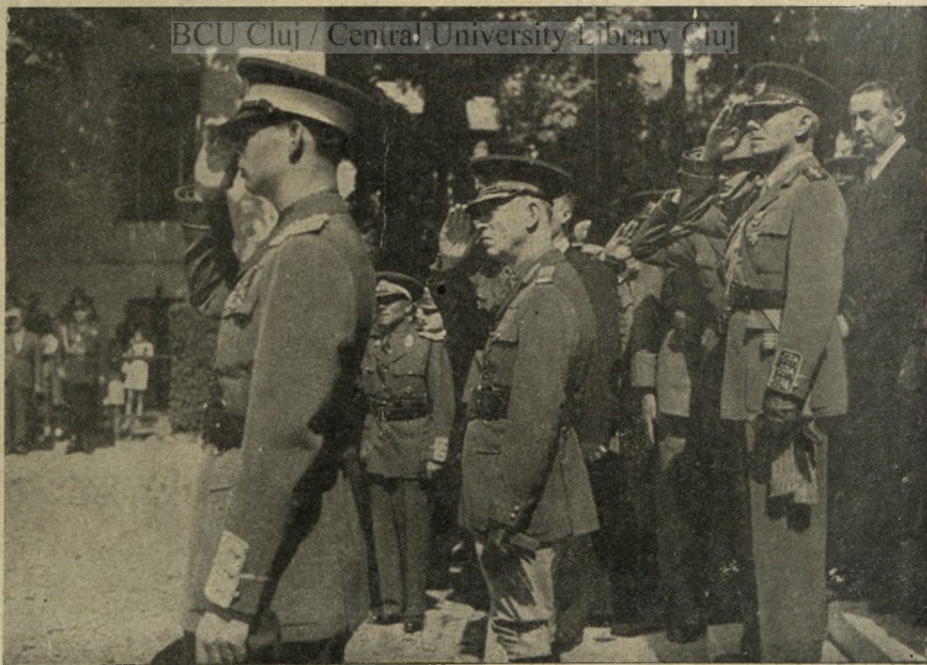
Maiestatea Sa Regele Mihai I și Domnul General Ion Antonescu Conducătorul Statului și Președinte al Consiliului de miniștri, la Te-Deumul dela Sf. Patriarhie.