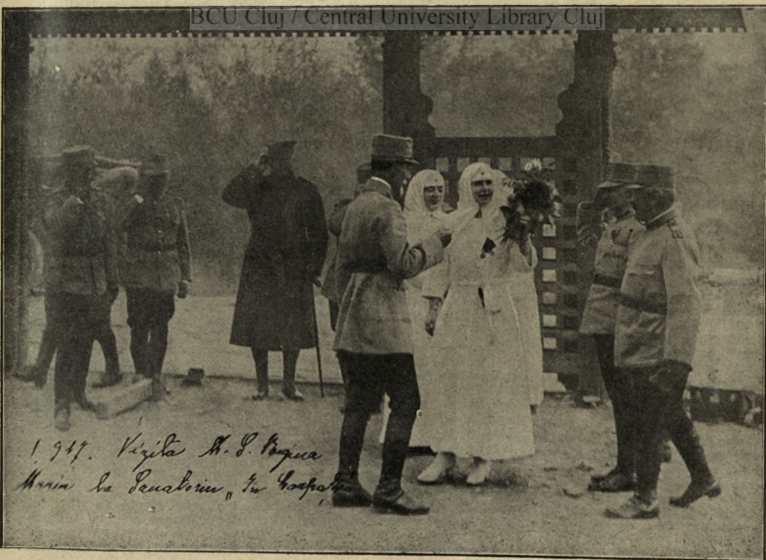
Regina Maria și Mareșalul Averescu în anul 1917 vizitând sanatoriul „In Carpați”