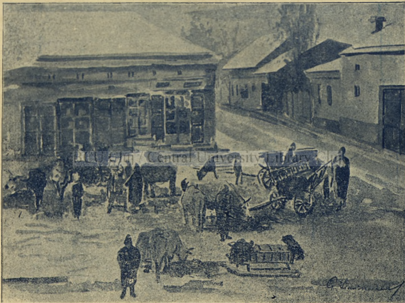
Aquarelă Severinul în Iarnă Târgul