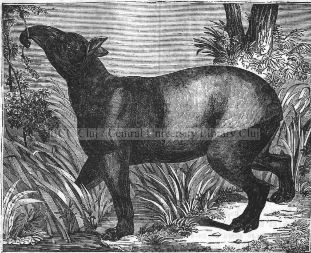
Fig. II. (Tapirul).

pidik̃z at̃z̃nč̃i în mai m̃z̃te indoit̃r̃i. Apoi fie-care acțiune m̃șk̃cloasť, m̃șkarđ dz̃ne ce a in-chetatđ, totđ lasť z̃rme dz̃ne d̃insa; k̃zč̃i la fie-care l̃zk̃rare sađ kontrakțiune a z̃nđi m̃șkđ ełđ se z̃nfl̃z; apoi kindđ l̃zk̃rarea sa a inchetatđ, ełđ totđ r̃z̃m̃ine чева z̃nfl̃atđ, prin z̃rmar̃e k̃z kitđ z̃nđ m̃șkđ l̃zk̃reazť mai m̃z̃lđ și kontrakți- nile sale se repet̃đ mai desđ, k̃z at̃itđ r̃z̃m̃inđ mai m̃z̃te z̃rme vizibil̃e pe aчестđ m̃șkđ, k̃z at̃itđ rem̃ine ełđ mai z̃nfl̃atđ pentr̃z toat̃z vieađa. Aчeasta ne esplicť observațiunile z̃r̃m̃z̃oare: