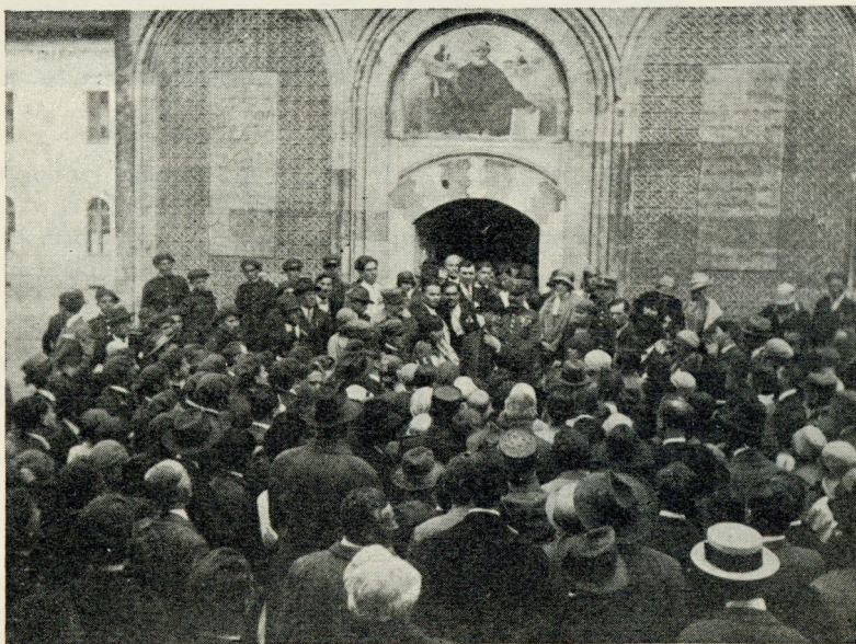
Liga la Mănăstirea Dealului