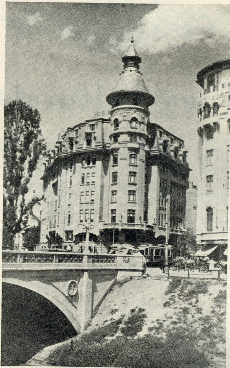
Palatul Ligii Culturale