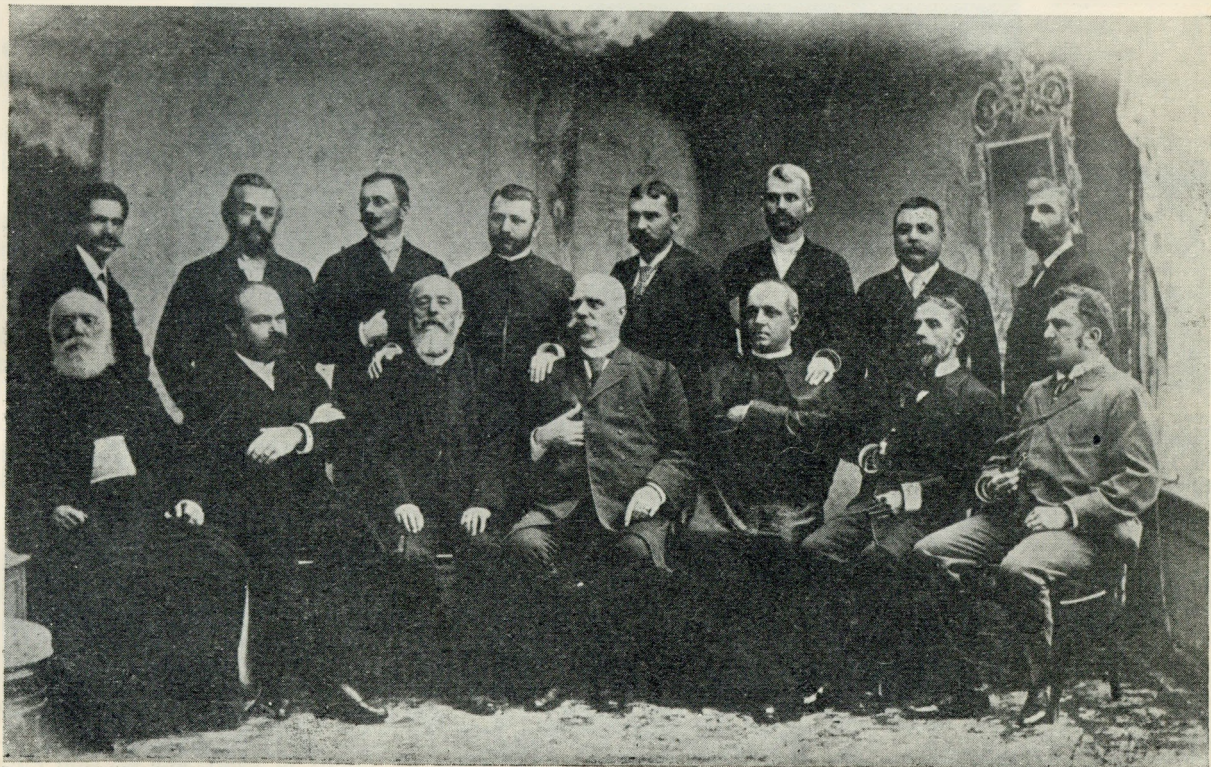
Din procesul Memorandului