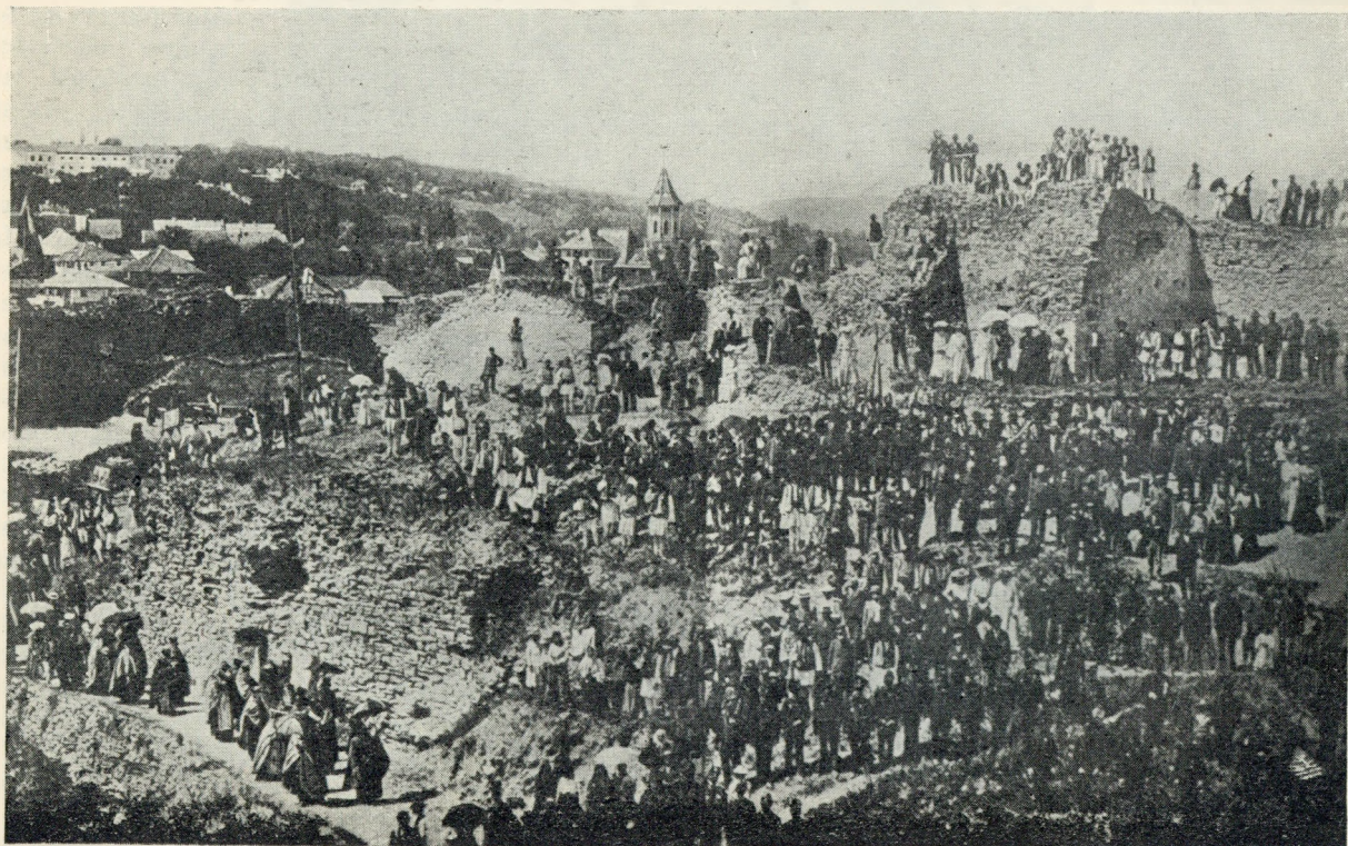
Serbarea a 400 de ani dela moartea lui Ștefan cel Mare, la Suceava, la 2 Iulie 1904