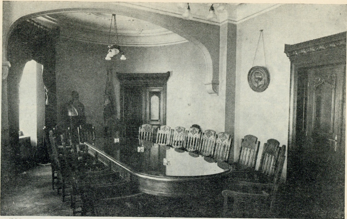
Sala de ședințe din Palatul Ligii