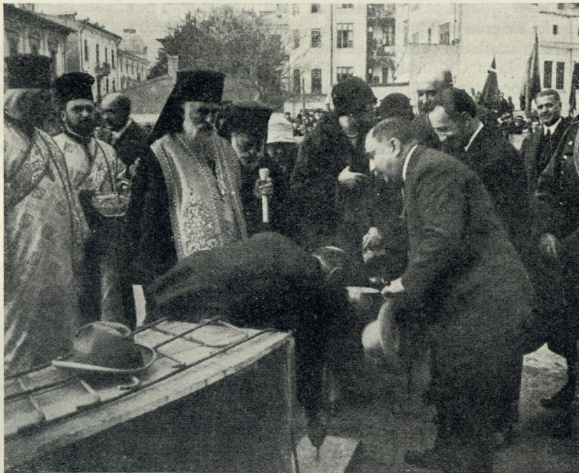
Punerea pietrei de temelie la Palatul Ligii la 8 Noiembrie 1926