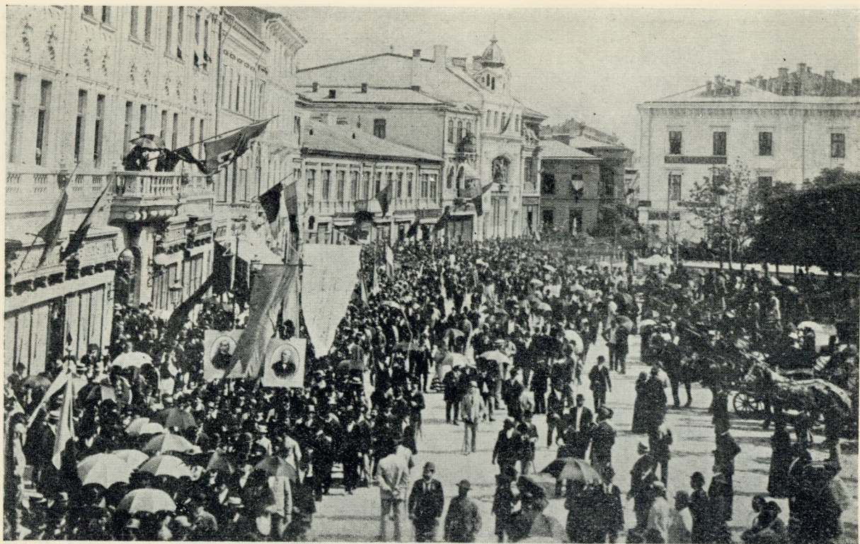
Manifestația studenților pentru Românii din Transilvania în București la 14 Iunie 1892