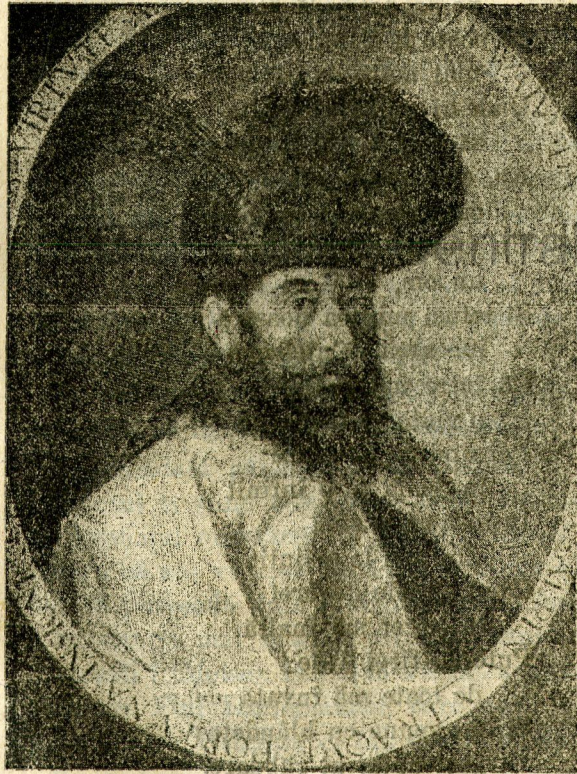
MIHAI VODA VITEAZUL

se primesc cu prețuri după in- voială la Administrația revistei.