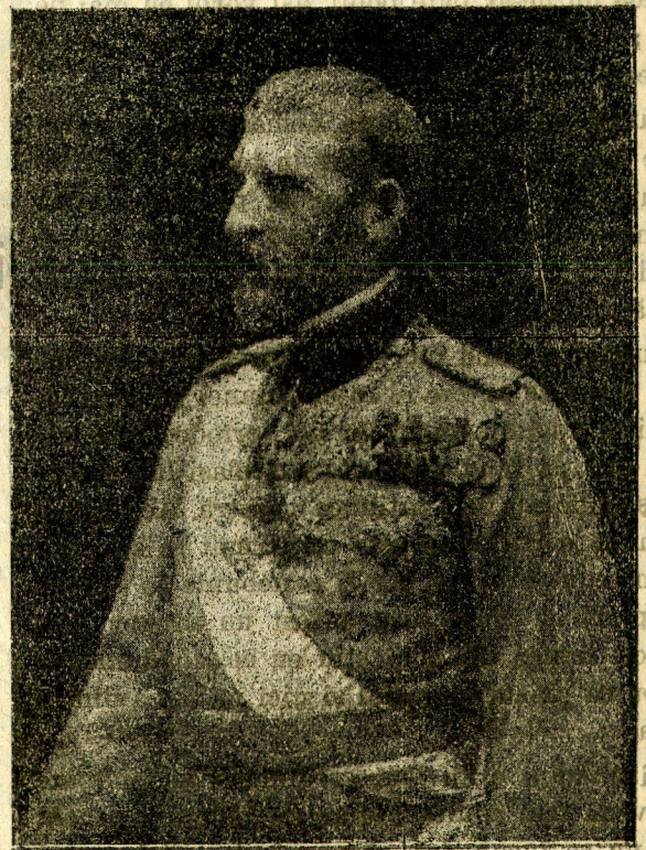
M. S. REGELE FERDINAND I

Eroi au fost, sunt și vor fi, Cât omenirea va trăi!