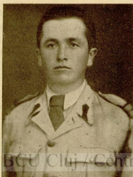
ENESCU ZICHIL BRAN-MOECIUL DE JOS