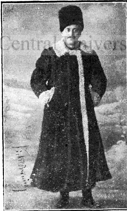
Ofițerul voluntar propagandist V. B. îmbrăcat în „șubă”, în drum spre lagărul de prizonieri din Tomsk.

Aceasta este vrea noastră ne linită, aceasta este credința noastră ne-strămutată, la care somăm să se ralieze ori ce români, ce simte românește, și are dragoste pentru sfânta noastră glie strămoșească!!