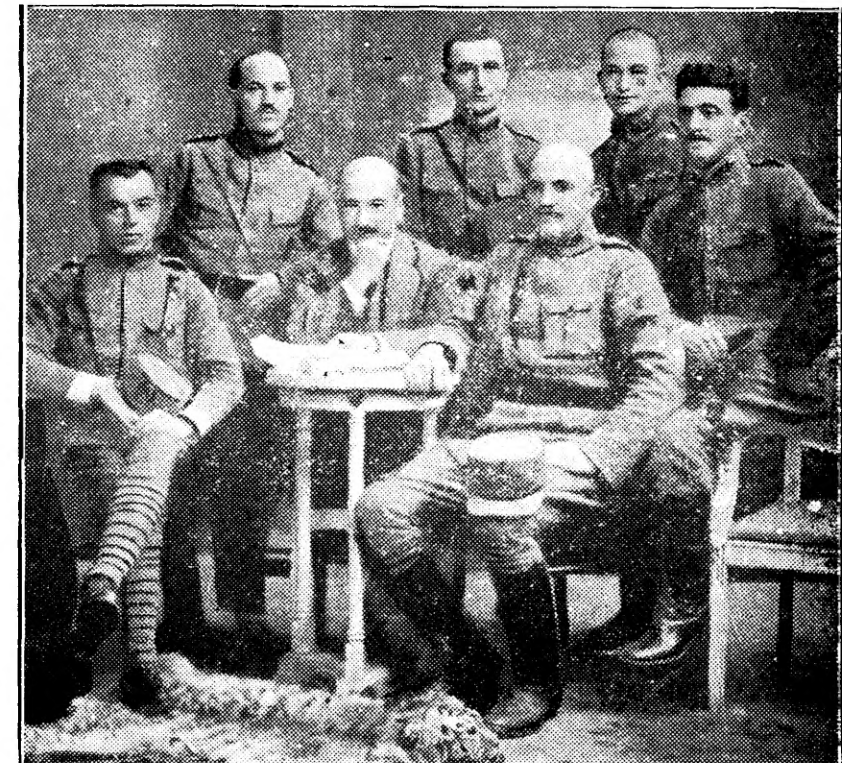
Un grup de ofițeri vol. din Vladivostok

bravi feciori ai Ardealului și ai Banatului, ai Crișanei, Bihorului, Maranureșului și ai Bucovinei, ascultați de glasul sângelui și al conștiinței voastre, părăsiți îndeletnicirile voastre de până acuma, rupeți toate legăturile cu cei ce vă duc pe căile pierzării, feriviți-vă sufletul de tina păcatului și nu ridicați brațul încontra mântuitorilor voștri, ci fugind de ispita și de ademenirile ei înșelătoare,