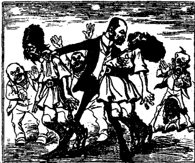
Tizsa: talite regremit' si apil, ortogai cu caldori la piapt.

Gândiți-vă că o astfel de ilustrație a colindat din mână în mână pe la zeci de mii de cetitori, ba și analfabeți și copii cari abea știu să buchisească.