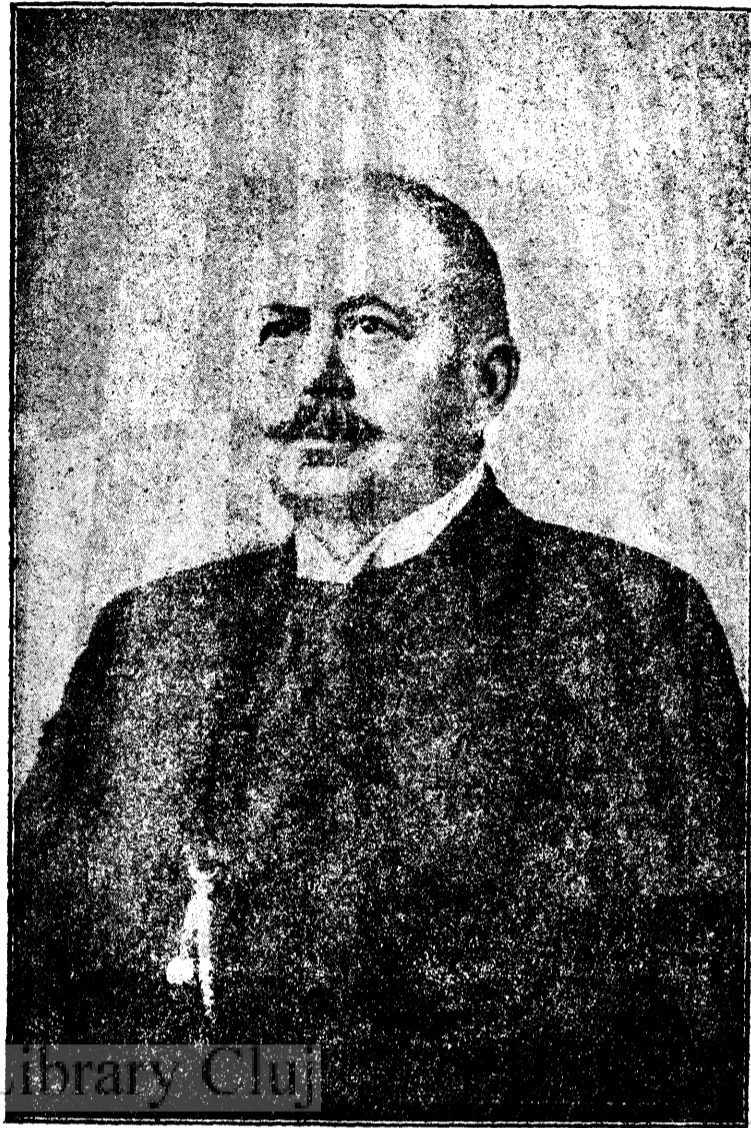
DIRECTORUL VIRGIL ONIȚIU n. 1864 † 1915.

manifestă „în înșăfășirea pentru ideal, în sentimentul comun al școlii cu poporul și cu biserica, din care s'a născut, în zelul nepregelat de muncă pentru lumină, în abnegațiune și jertfă și în ferma credință în Dumnezeu”.