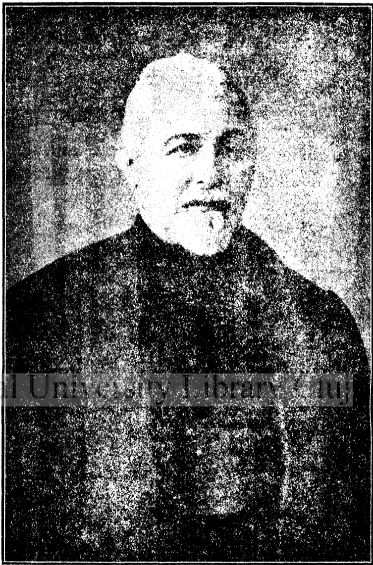
PROTOERUL DR. IOSIF BLAGA

Adunarea atâtor intelectuali pentru un jubileu cultural de importanță ceia de azi e bine să cugete la toate urmările bune