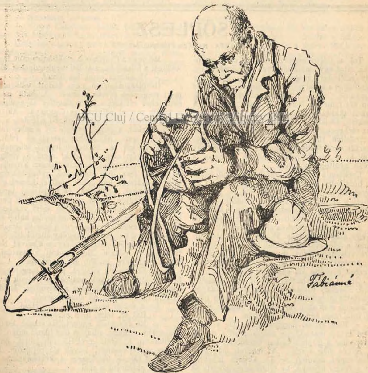
AZ ÖREG MUNKÁS.