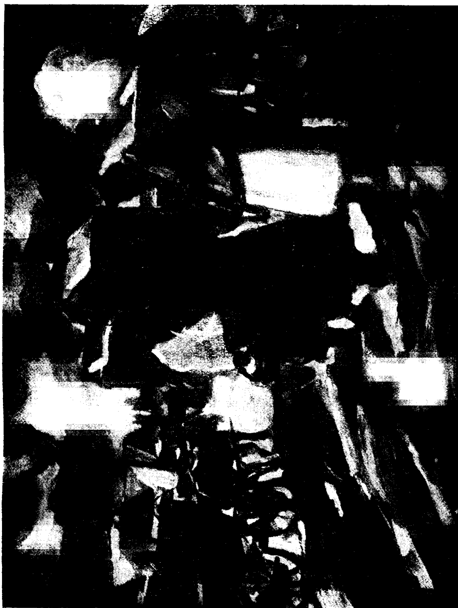
Elena Popca: Zi de targ iarna lângă Cluj