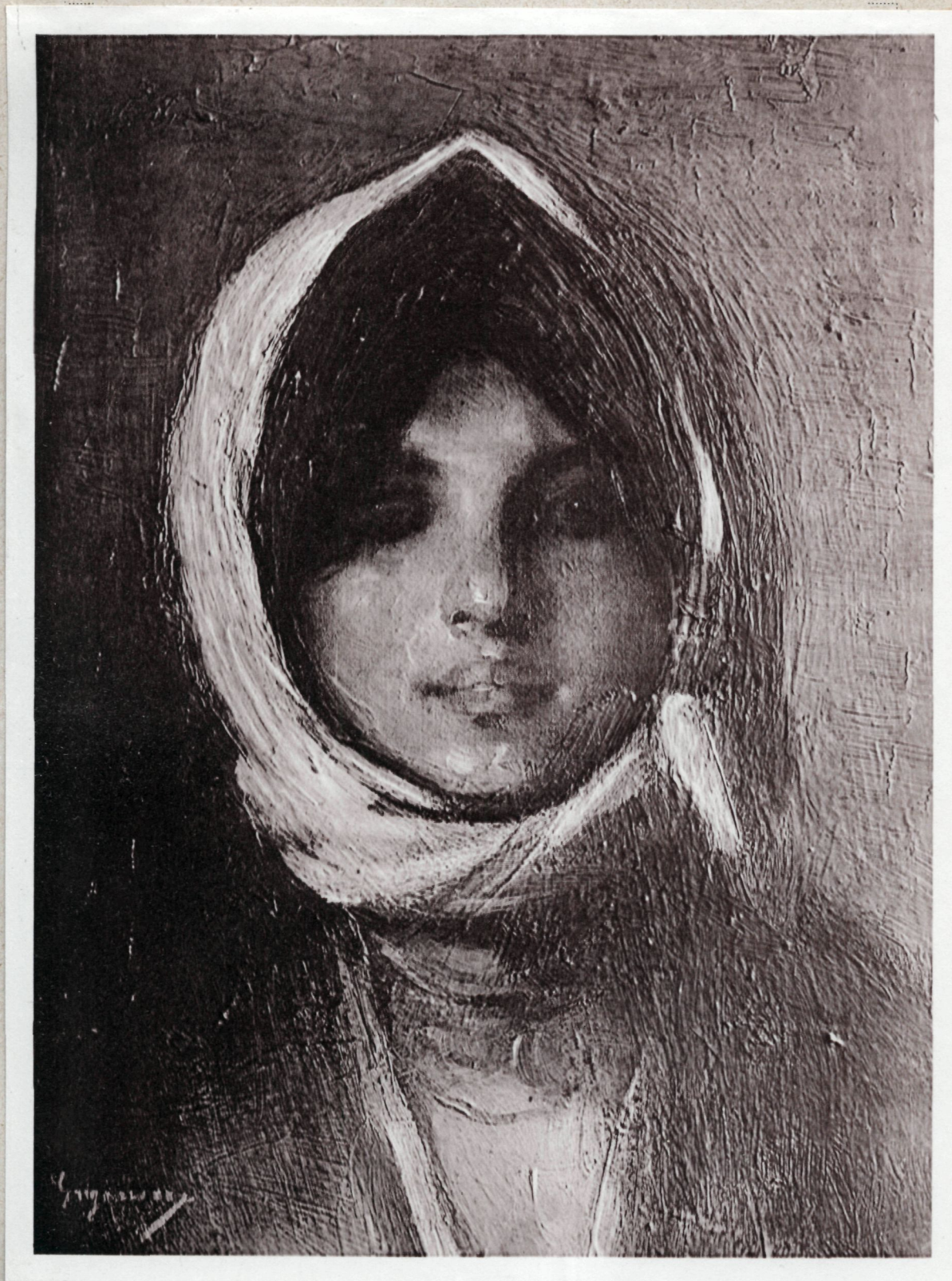
Grigorescu: Tărăncuță (colecția Carada).