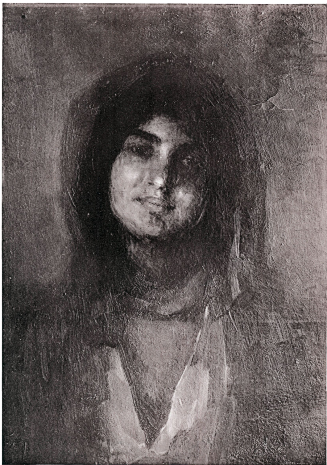
Grigorescu: Țigancă (colecția Carada).