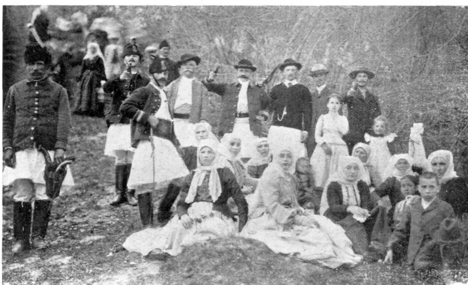
Paștile la Brașov : Lagăr în pădure.

să se despartă unul de altul. Minciunile și zvonurile se spărgeau de stinca purtării lor alese și neprihănite. Vacanța Crăciunului a trecut ca un vis.